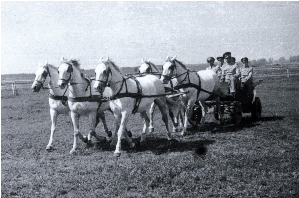
S. Deskur. Hodowla koni w Polsce (VI). Wiad. Zoot. , 2004, XLII, 3: 67–70

Kolekcja książek rodziny Deskurów z Sancygniowa wchodząca w skład księgozbioru Wojewódzkiej Biblioteki Publicznej w Kielcach została włączona do Narodowego Zasobu Bibliotecznego. Składa się z 2670 pozycji, z których najstarsza, dotycząca historii Polski pochodzi z 1571 roku.