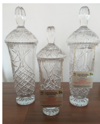
Fot. 6. Liczne puchary przyznane kaczkom i gęsiom SZGDW w Dworzyskach podczas II Regionalnej Wystawy Zwierząt Hodowlanych w Sielinku