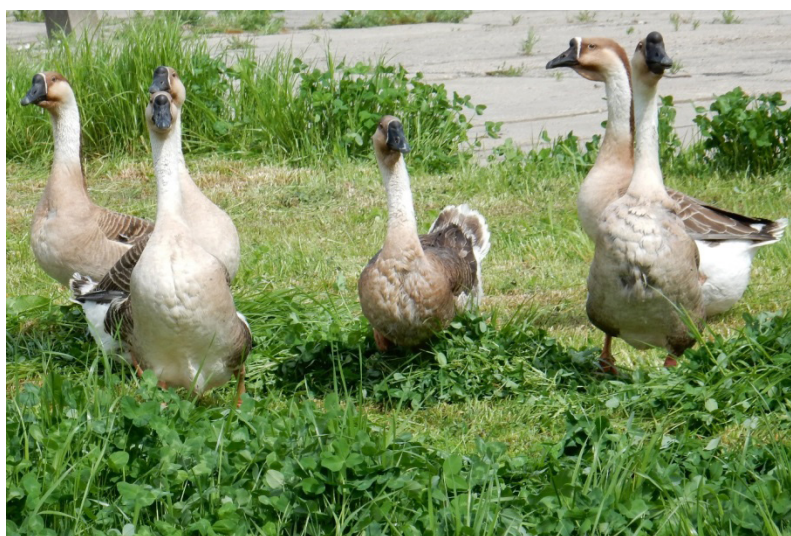
Fot. 2. Gęsi kubańskie (Ku)

W ramach omawianej imprezy odbyła się największa w historii Krajowa Wystawa Ras Rodzimych, na której SZGDW w Dworzyskach przedstawiła do oceny wybrane stadka objęte programem ochrony zasobów genetycznych zwierząt. Były to: gęsi – kielecka (Ki), podkarpacka (Pd), garbonosa (Ga), rypińska (Ry), pomorska (Po), landes (LsD-01) i kaczki – pekin