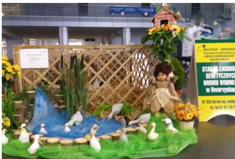
Fot. 5. Stanowisko SZGDW w Dworzyskach na Narodowej Wystawie Zwierząt Hodowlanych w Poznaniu

Sezon wystawienniczy 2019 r. należy uznać za bardzo udany dla kaczek i gęsi z SZGDW w Dworzyskach, a przyznane tytuły i nagrody są wskaźnikiem prawidłowości realizowanych prac hodowlanych na fermie oraz źródłem satysfakcji dla pracowników.