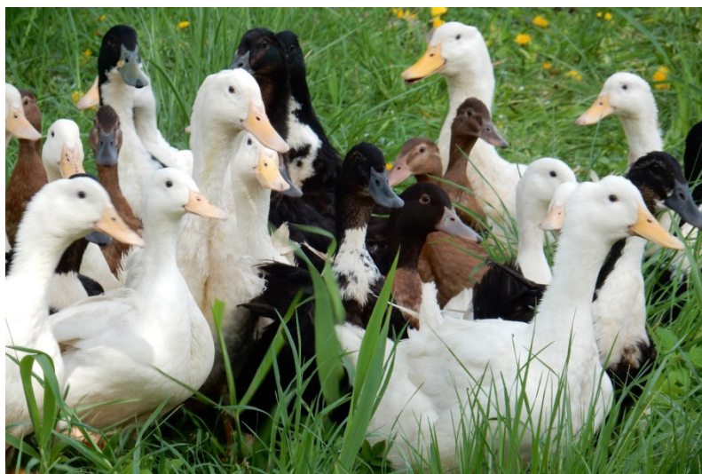
Fot. 4. Kaczki: pekin krajowy (P-33, białe), mieszańce (KhO-1, brązowe), dworka (D-11, czarne z białym krawatem)