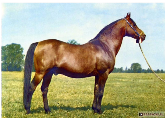
Fot. 1. Ogier Celebes (fot. Z. Raczkowska) https://www.bazakoni.pl/celebes-witra-canaria Photo 1. Celebes stallion

Celebes pozostawił w stadninach Michałów i Janów 98 sztuk potomstwa, utrwalając w ich genotypie i fenotypie krew Ofira i Khailana Haifi. W hodowli użyto kilku jego wartościowych synów: Melona (Celebes/Mantyla po Grand), Etapa (Celebes/Etna po Faher), Algomeja (Celebes/Algonkina po Pietuszek), Aloesa (Celebes/Algoa po Czort) i Pepi (Celebes/Pemba po Czort). Celebes padł 31 stycznia 1978 r. w Janowie Podlaskim w wieku 29 lat.