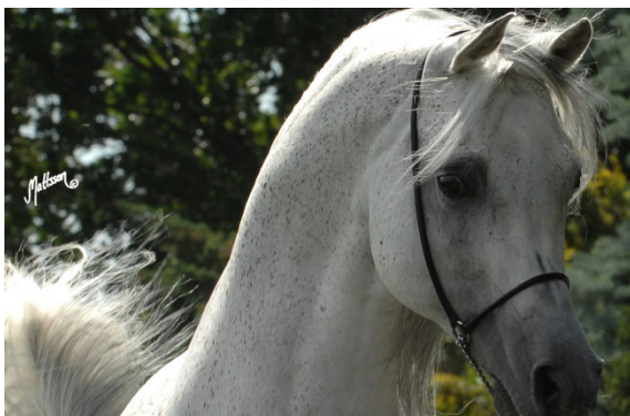
Fot. 36. Ogier Ekstern Photo 36. Ekstern stallion