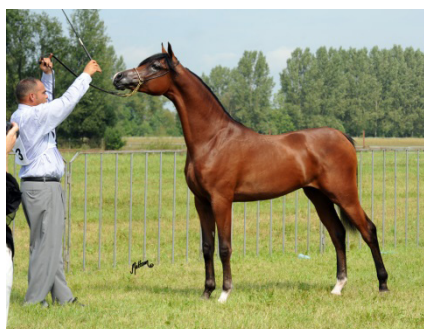
Fot. 20. Roczny ogierek Pogrom Photo 20. Pogrom stallion as a yearling

Gniady Pogrom (QR Marc/Pętla po Visbaden) urodził się 30 kwietnia 2009 r., będąc kontynuatorem rodu męskiego wywodzącego się od ogiera Saklawi I i linii żeńskiej klaczy Szamrajówka. Jego ojciec, reproduktor amerykańskiej hodowli był zdobywcą tytułów Czempiona Świata Ogierów Starszych (2012), Czempiona Pucharu Narodów (2012), dwukrotnie Wiceczempiona Świata Ogierów Starszych (2010 i 2011) i Wiceczempiona Świata Ogierów Młodszych (2008). Matka jest potomkinią ogierów Bandos, Comet, Witraz i Wielki Szlem (tab. 8).