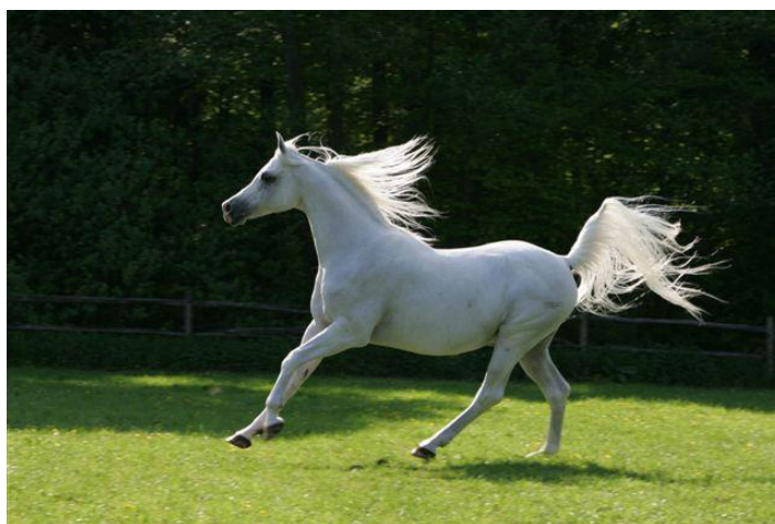
Fot. 40. Ogier Pesal (fot. J. Jonientz) http://www.arabhorsenews.com/Klarenbeek/pesal.htm Photo 40. Pesal stallion