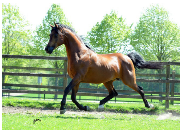
Fot. 33. Ogier Ganges Photo 33. Ganges stallion