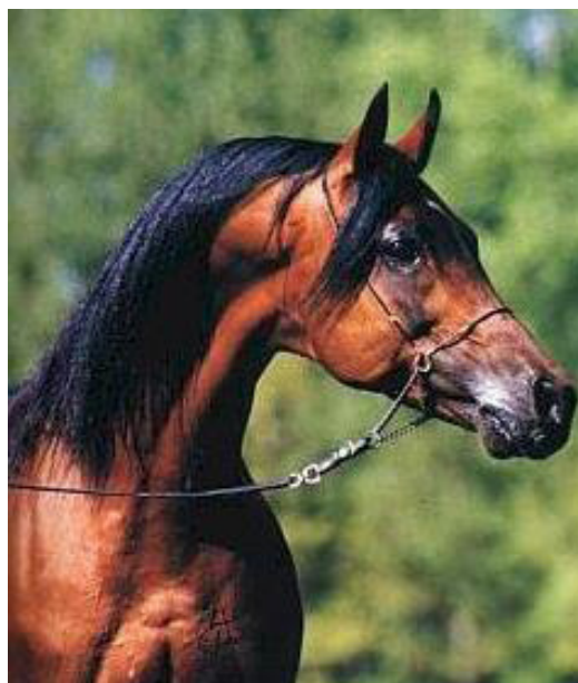
Fot. 28. Ogier Wojśław; Photo 28. Wojśław stallion

Wojśław jest również ojcem pięknego Emanora (Wojśław/Emanacja po Eukaliptus) – Czempiona Polski, USA, Wicczempiona Kanady i Czempiona ze Scottsdale. W polskiej hodowli użyto dwóch synów Wojśława – Monara (Wojśław/Mirtęga po Probat) i Werbuma (Wojśław/Werda po Piechur) – Czempiona Ogierów Starszych Warszawskiego i Letniego Pokazu.