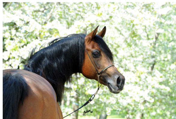
Fot. 34. Ogier Ganges Photo 34. Ganges stallion

Pozostawił po sobie ponad 260 potomków. Znaczną ich część charakteryzują doskonale predyspozycje wyścigowe, czego potwierdzeniem może być wygrana w Derby ogiera Don Carlos (Ganges/Decyzja po Pamir) w 2005 r. Podczas pokazów wyróżniały się jego córki – klacz Wieża Wiatrów (Ganges/Wiazma po Arbil) – Czempionka Klaczy z Białki i Młodzieżowa Wiceczempionka Polski (2002), sprzedana na aukcji Pride of Poland (2002) za 220 000 $ oraz klacz Dobra Nowina (Ganges/Dzięcielina po Arbil) – Wiceczempionka Klaczy z Białki i Młodzieżowa Wiceczempionka Klaczy międzynarodowego pokazu w Poznaniu (2003), a także Czempionka Klaczy Młodszych z Bełżyc (2004). Na wyróżnienie zasługują również Diaspora (Ganges/Dalida po Probat), Drzewica (Ganges/Dzięcielina po Arbil), Złota Księga (Ganges/Zatoka po Arbil), Wróżka (Ganges/Wipera po Fawor) i Złota Wieża (Ganges/Zatoka po Arbil). W kwietniu 2018 r. Ganges ukończył 24 lata i nadal pozostaje w macierzystej stadninie. Jego imieniem nazwano odbywającą się na służewieckim torze gonitwę dla 3-letnich koni czystej krwi arabskiej I grupy na dystansie 1800 m.