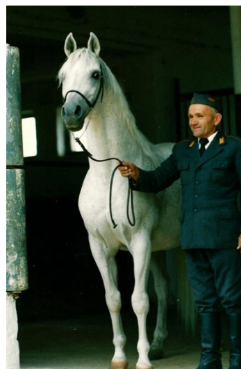
Fot. 10. Ogier Eukaliptus http://www.janow.arabians.pl/pl/oferta/ogierzy/oo/?nrk=780 Photo 10. Eukaliptus stallion