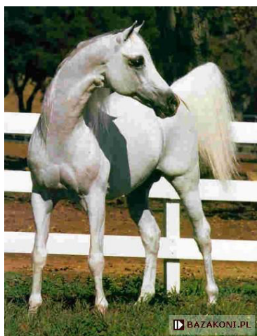
Fot. 6. Ogier Bandos w USA https://www.bazakoni.pl/bandos-negativ-bandola Photo 6. Bandos stallion in USA