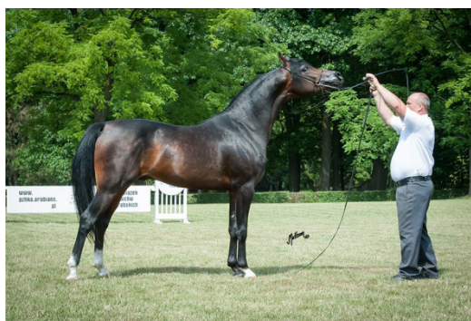
Fot. 41. Ogier Cefir Photo 41. Cefir stallion

Ciemnogniady Cefir (Eryks/Celina po Metropolis NA) (fot. 41, 42, 43), będący przedstawicielem rodu Saklawi I i rodziny klaczy Bent el Arab or.ar., urodził się w 2011 r. Linia żeńska jego matki klaczy Celina wywodzi się z hodowli węgierskiej i jest bardzo nielicznie reprezentowana w Polsce (tab. 15).