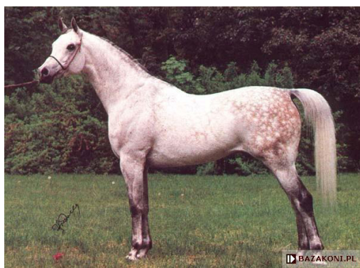
Fot. 14. Ogier Pamir (fot. Z. Raczkowska) https://www.bazakoni.pl/pamir-probat-parma Photo 14. Pamir stallion

Na torach wyścigowych biegał przez dwa sezony, biorąc udział w jedenastu gonitwach (5-0-4-2). Wygrał między innymi nagrodę Derby, Bandosa i Sambora. Uczestnicząc w pokazach dwa razy zdobył tytuł Wiceczempiona Polski Ogierów Starszych (1989 i 1990), Czempiona Polski Ogierów Starszych w 1993 r., a w 1990 r. wygrał Puchar Świata w Sztokholmie.