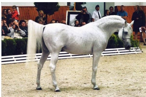
Fot. 35. Ogier Ekstern (fot. M. Sawczynszyn-Pawlus) http://www.stajnia-oxer.pl/mojekartki2016.html Photo 35. Ekstern stallion