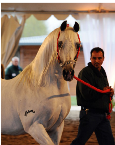
Fot. 18. Ogier Ecaho w Haras de Cardenas w 2010 r. Photo 18. Ecaho stallion in Haras de Cardenas in 2010