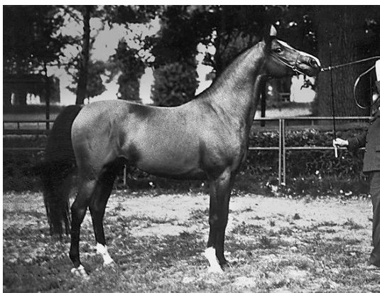
Fot. 12. Ogier Europejczyk (autor nieznan, fot. z archiwum W. Kwiatkowskiego) http://www.janow.arabians.pl/pl/oferta/ogierzy/oo/?nrk=266 – Photo 12. Europejczyk stallion