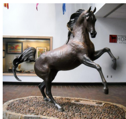
Fot. 4. Posąg Baska w Kentucky Horse Park; https://pl.pinterest.com/pin/245657354646721490/?lp=true Photo 4. Bask statue at Kentucky Horse Park