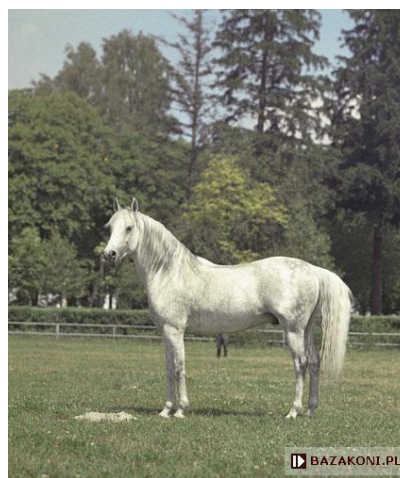
Fot. 7. Ogier Bandos (fot. Z. Raczkowska) https://www.bazakoni.pl/bandos-negativ-bandola Photo 7. Bandos stallion

Do najcenniejszych synów reproduktora należały: Eukaliptus (Bandos/Eunice po Comet), Pepton (Bandos/Pemba po Czort) i Złoty Potok (Bandos/Zamieć po Czardasz). Bandos padł 21 września 1987 r. w wieku 23 lat. Jego imieniem została nazwana gonitwa rozgrywana na służewieckim torze wyścigowym dla 4-letnich ogierów i klaczy czystej krwi arabskiej.