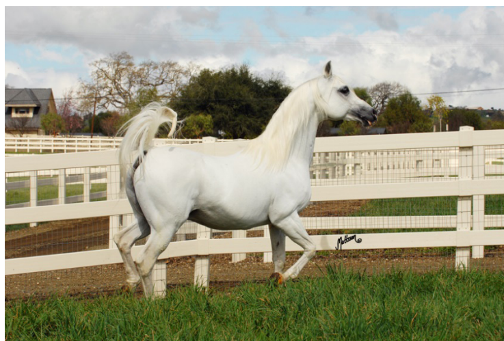
Fot. 19. Ogier Ecaho w Santa Ynez w 2009 r. Photo 19. Ecaho stallion in Santa Ynez in 2009