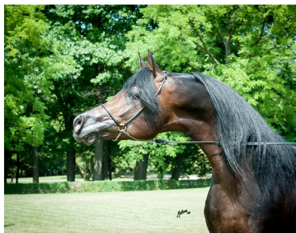
Fot. 43. Ogier Cefir Photo 43. Cefir stallion

Nie sposób jednoznacznie określić wielkość wpływu danego ogiera na polską lub zagraniczną hodowlę ani w sposób nie pozostawiający wątpliwości wyłonić najlepszego ogiera wyhodowanego w wymienionych stadninach. Każdy z charakteryzowanych reproduktorów wywarł wpływ i wniósł sobie właściwy wkład w rozwój polskiej hodowli. Dokonanie obiektywnego porównania utrudnia także fakt, że były one użytkowane w różnych latach, na różnych etapach udoskonalania pogłowia rasy. Niemniej to właśnie różnorodność i liczebność tych wspaniałych koni stworzyła potęgę i niepowtarzalny charakter polskiej hodowli, cieszącej się tak wielkim uznaniem i zainteresowaniem na arenie międzynarodowej.