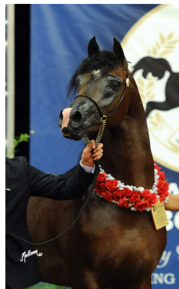
Fot. 22. Ogier Pogrom Photo 22. Pogrom stallion