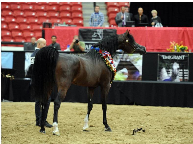
Fot. 21. Ogier Pogrom podczas pokazu w Las Vegas Photo 21. Pogrom stallion in Las Vegas

W 2014 r. Pogrom powrócił do macierzystej stadniny i zajął boks ogiera czołowego. W swojej dotychczasowej pięcioletniej karierze hodowlanej dał już 218 potomków. Jego potomstwo to młode konie, z których większość urodziła się w USA. Ogier cieszy się zainteresowaniem hodowców w Kanadzie, Francji, Holandii, Włoszech, Austrii, Szwecji, Argentynie, Australii i Brazylii. Pierwsze źrebię po Pogromie przyszło na świat w Polsce w 2014 r. Ogier zachwyca szlachetnym typem budowy, szerokim czołem, wielkością i wyrazistością oka i pięknie osadzoną, długą szyją.