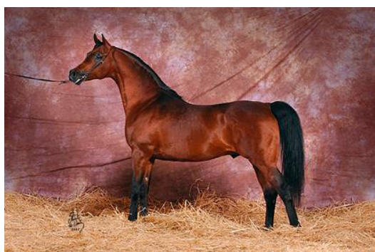
Fot. 32. Ogier Ganges (fot. S. Vesty) http://pofp2014.vdl.pl/pl/node/1478 Photo 32. Ganges stallion

Gniady Ganges (Monogramm/Garonna po Fanatyk) (fot. 32, 33, 34) urodził się 6 kwietnia 1994 r. jako potomek rodu ogiera Kuhailan Haifi or.ar. i rodziny klaczy Gazella or.ar. (tab. 12). Jego ojciec Monogramm to amerykański czempion, który już za życia stał się legendą, będąc Wiceczempionem Ogierów Młodszych USA (1988) i dwukrotnie zdobywcą tytułu Top Ten Ogierów USA (1991 i 1992), ale przede wszystkim ojcem sporej stawki doskonałego potomstwa. Matka Gangesa, klacz Garonna to Wiceczempionka Polski Klaczy Młodszych (1987) i zwyciężczyni nagrody Liry (Oaks) w wyścigowych próbach dzielności.