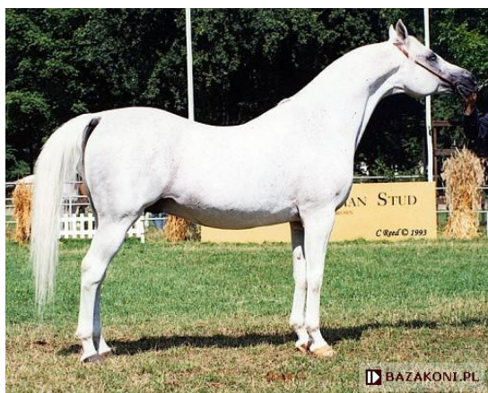
Fot. 8. Ogier Eukaliptus https://www.bazakoni.pl/eukaliptus-Bandos-eunice – Photo 8. Eukaliptus stallion