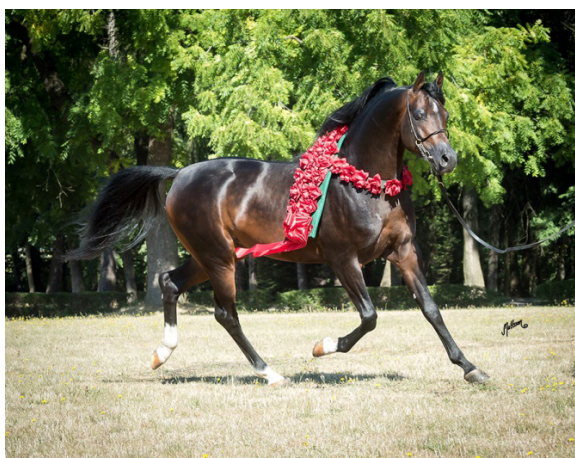
Fot. 42. Ogier Cefir Photo 42. Cefir stallion

Cefir, podobnie jak jego ojciec Eryks, zachwycał wybitnym ruchem, poprawną budową i dużym, pięknym okiem. Zdobył tytuły: Top Five Wiosennego Pokazu Młodzieżowego w Białce (2014), dwukrotnie Wiceczempiona Warszawskiego Pokazu Arabia-Polska Ogierów Młodszych (2014 i 2015), Top Five Czempionatu Polski ogierów Młodszych (2014) oraz Czempiona Polski Ogierów Starszych (2015). W 2015 r. rozpoczął karierę hodowlaną w macierzystej stadninie. Był oferowany na sprzedaż podczas Zimowej Aukcji w SK Michałów w 2016 r., lecz nie znalazł nabywcy. Cefir padł w listopadzie 2017 r., pozostawiając po sobie zaledwie garstkę potomstwa.