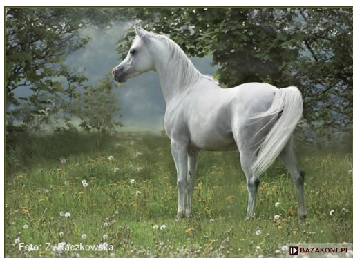
Fot. 38. Ogier Pesal (fot. Z. Raczkowska) https://www.bazakoni.pl/pesal-partner-perforacja Photo 38. Pesal stallion

Siwy Pesal (Partner/Perforacja po Ernal) (fot. 38, 39, 40) urodził się 14 stycznia 1991 r. Reprezentuje ród ogiera Ilderim or.ar. i linię żeńską klaczy Szamrajówka. Partner, ojciec Pesala to Wiceczempion Polski Ogierów Starszych (1979), który swojemu potomstwu przekazywał kaliber i dobry ruch. Matka, klacz Perforacja jest córką założycielki białeckiej linii „P”, wywodzącej się od epokowej Piewicy (Priboj/Włodarka po Ofir) (tab. 14).