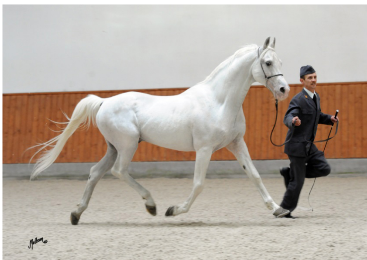
Fot. 24. Ogier Eldon w wieku 29 lat Photo 24. 29-year-old Eldon stallion