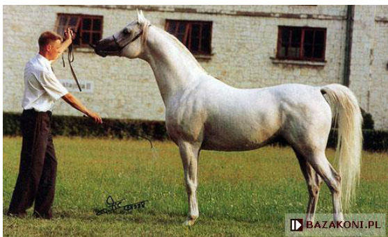
Fot. 17. Ogier Ecaho https://www.bazakoni.pl/ecaho-pepton-etruria Photo 17. Ecaho stallion