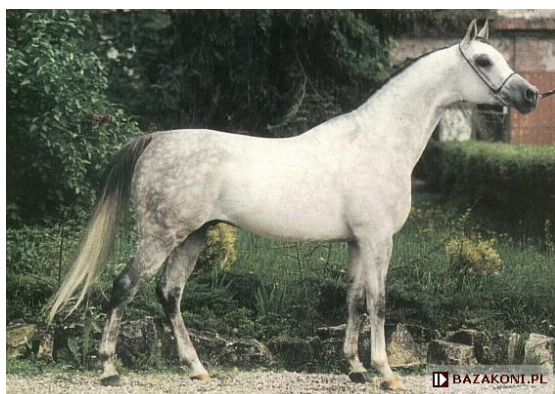
Fot. 29. Ogier Emigrant; https://www.bazakoni.pl/emigrant-ararat-emigrantka Photo 29. Emigrant stallion

Siwy Emigrant (Ararat/Emigrantka po Eukaliptus) (fot. 29, 30), przedstawiciel rodu Saklawi I i rodziny klaczy Milordka urodził się 30 stycznia 1991 r. Jego matka Emigrantka, zdobywczyni tytułu Czempionki Polski Klaczy Starszych (1992) i Czempionki Europy Klaczy (1991) to jedna z najlepszych córek Eukaliptusa i jedna z najcenniejszych michałowskich klaczy. Ojciec Emigranta to Czempion Polski Ogierów Starszych z 1999 r. siwy Ararat. Emigrant był zimbredowany 3x2 na ogiera Palas i 3x3 na ogiera Bandos (tab. 11).