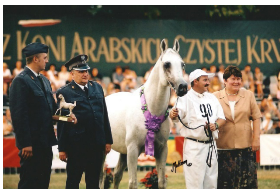
Fot. 30. Emigrant jako Czempion Polski Photo 30. Emigrant stallion – Polish Champion