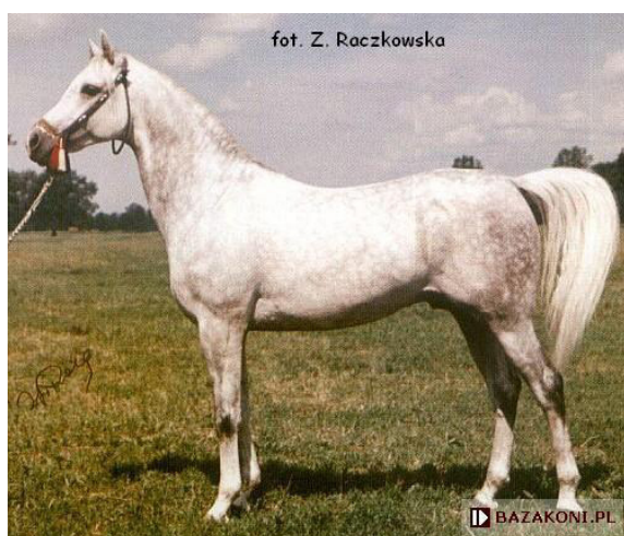
Fot. 5. Ogier Bandos (fot. Z. Raczkowska) https://www.bazakoni.pl/Bandos-negativ-bandola Photo 5. Bandos stallion

Siwy Bandos (Negativ/Bandola po Witraż) (fot. 5, 6, 7) urodził się 15 stycznia 1964 r. Reprezentował ród męski Ibrahim or.ar. i linię żeńską klaczy Mlecha or.ar. Matka Bandosa, fenomenalna Bandola nazywana „królową Janowa”, a nawet „królową Polski” była jedną z najwybitniejszych klaczy w historii hodowli koni czystej krwi arabskiej (tab. 3).