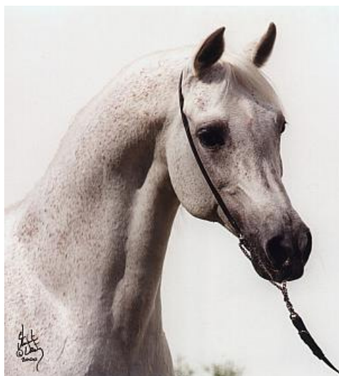
Fot. 9. Ogier Eukaliptus (fot. S. Vesty) http://www.janow.arabians.pl/pl/oferta/ogierzy/oo/?nrk=3780 – Photo 9. Eukaliptus stallion

Wśród synów Eukaliptusa na wyróżnienie zasługują Nimb (Eukaliptus/Nejtyczanka po Banat), uzdolniony wyścigowo Harbin (Eukaliptus/Halfa po Palas) i Grafik (Eukaliptus/Gaskonia po Probat), jak również jego wnuk, czempion USA – Emanor (Wojśław/Emanacja po Eukaliptus). Najbardziej wartościowe z hodowlanego punktu widzenia potomstwo uzyskiwano w efekcie kojarzenia Eukaliptusa z michałowską Emigracją (Palas/Emisja po Carycyn). Eukaliptus zakończył karierę hodowlaną w wieku 26 lat. Padł 18 lipca 2001 r. w wieku 27 lat. Jego potomstwo cieszy się ogromnym zainteresowaniem wśród hodowców zagranicznych.