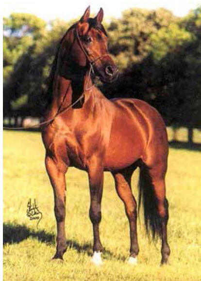
Fot. 27. Ogier Wojśław Photo 27. Wojśław stallion

– zwycięzca Derby, gonitwy o nagrodę Porównawczą (dwukrotnie) i Europy (dwukrotnie). W 1999 r. Druid został sprzedany do Turcji za rekordową sumę 500 000 $.