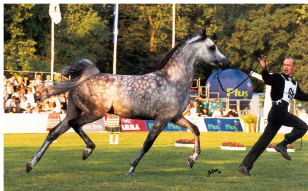
Fot. 37. Niesamowity ruch Eksterna Photo 37. Ekstern stallion and its amazing movement

Krył w stadninach w Janowie, Michałowie, Białce i Jadem Arabians w Belgii. Pozostawił po sobie niebagatelną liczbę potomstwa, przekraczającą 450 sztuk. Przekazywał wspaniały typ, egzotyczną głowę i doskonały ruch (Luft, 2015). Jego córka Wilga (Ekstern/Wenessa po Egon) wygrała klasę na Czempionacie Europy w Weronie (2001); Palanga (Ekstern/Panika po Eukaliptus) została Młodzieżową Czempionką Europy (2003); Esparto (Ekstern/Ekspozycja po Eukaliptus) Młodzieżową Wicczempionką Polski i Czempionką Ogierów Młodszych międzynarodowego pokazu w Poznaniu (2003); Sefora (Ekstern/Sawantka po Pepton) Czempionką Polski Klaczy Młodszych (2006) i zdobywczynią tytułów Top Five Pucharu Narodów i Top Ten Czempionatu Świata (2006); Psyche Victoria (Ekstern/Pallas-Atena po Ecaho) zdobywczynią tytułu Top Ten Czempionatu Świata (2007); a Psyche Kreuza (Ekstern/Pallas-Atena po Ecaho) zdobywczynią tytułów Top Ten Czempionatu Świata Klaczy Młodszych (2009 i 2010) i Top Five Czempionatu Europy (2010). Również zagraniczne potomstwo Eksterna przysporzyło hodowcom wiele powodów do dumy.