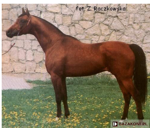
Fot. 26. Ogier Wojsław (fot. Z. Raczkowska) https://www.bazakoni.pl/wojsaw-tallin-wilejka Photo 26. Wojsław stallion

Gniady Wojsław (Tallin/Wilejka po El Paso) (fot. 26, 27, 28) urodził się w 1986 r. Pochodził z rodu ogiera Bairactar or.ar. i linii żeńskiej klaczy Sweykowska (tab. 10).