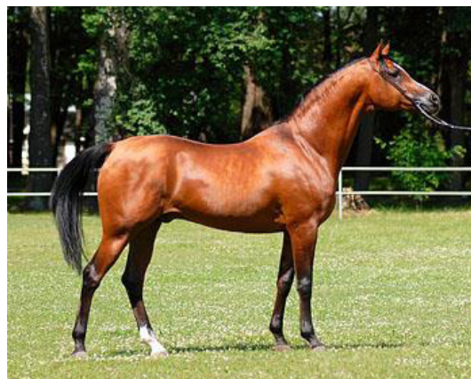
Fot. 13. Ogier Album (fot. W. Pawłowski) http://www.janow.arabians.pl/pl/oferta/ogierzy/oo/?nrk=266 Photo 13. Album stallion