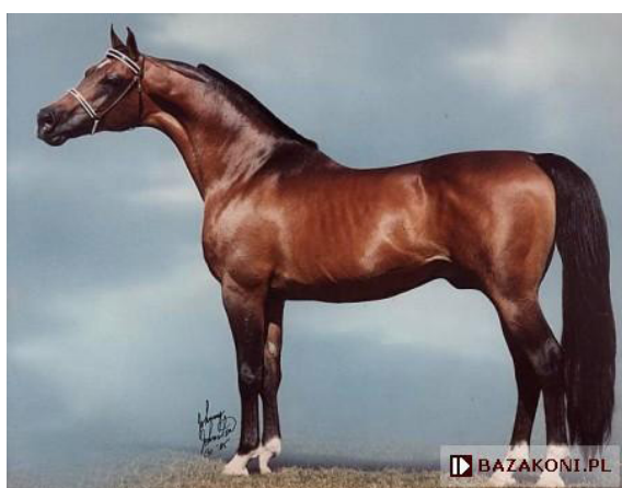
Fot. 2. Ogier Bask https://www.bazakoni.pl/bask-witra-baaajka Photo 2. Bask stallion

niejszym koniem arabskim. Zdobył tytuły czempiona ogierów w Scottsdale (1964), czempiona ogierów USA (1964), Top Ten Czempionatu USA w Saddle Seat (1964), wiceczempiona Saddle Seat w Spokane (1965), czempiona USA w Saddle Seat (1965), czempiona Saddle Seat w Scottsdale (1966), wiceczempiona USA w Powożeniu (1967), wiceczempiona USA w Jeździe Klasycznej (1967) oraz tytuł Legion of Merit (1965) przyznawany za wybitne osiągnięcia. Został na tak wielką skalę użyty w amerykańskiej hodowli, że do dziś występuje w rodowodach 25% koni arabskich w USA (Pudyszak, 2018). Pozostawił po sobie niebagatelną liczbę 1046 potomków, z których 495 uzyskało tytuł czempiona a 197 Czempiona Narodowego USA. Bask był nazywany „objawieniem Ameryki”. Mimo że jego poprawny typ nie urzekł polskich hodowców, dla amerykańskich stał się uosobieniem arabskiego ideału. Bask padł 24 lipca 1979 r. w wieku 23 lat. Przed wejściem do Kentucky Horse Park stoi posąg Baska naturalnej wielkości, wykonany przez Edwina Boguckiego (fot. 4) a jego miniaturka znajduje się w Janowie Podlaskim. W 2017 r. powstał film dokumentalny „BASK. The revelation of America”.