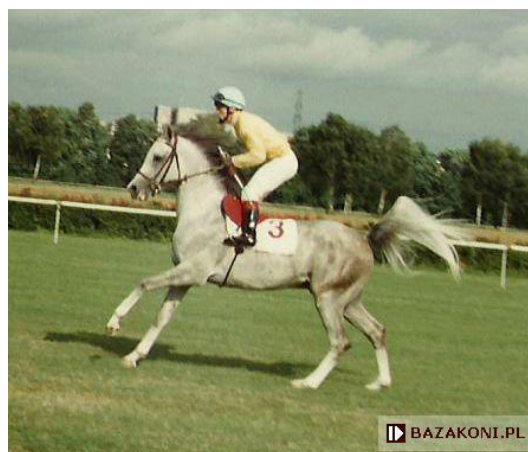
Fot. 16. Ogier Gepard przed startem w gonitwie Derby w 1995 r. (fot. A. Zacharska) https://www.bazakoni.pl/gepard-pamir-giza Photo 16. Gepard stallion before starting in Derby race in 1995