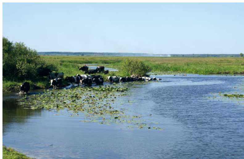
Opracowanie i fot. D. Dobrowolska (Nad Biebrzą)