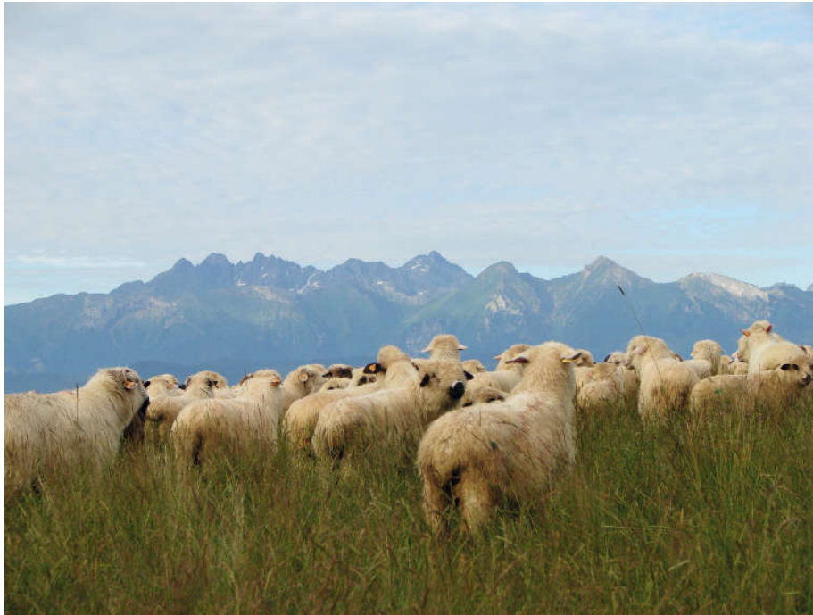
Owce górskie w Pieninach