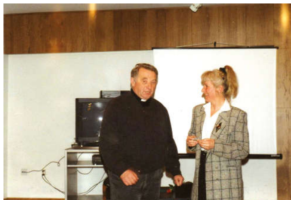
Ks. prof. Józef Tischner