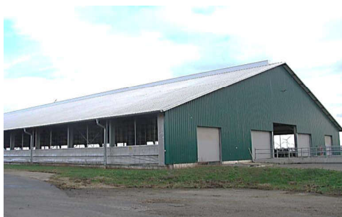
Fot. 1. Prawidłowe ustawienie obory wolnostanowiskowej (północ-południe), duża kubatura, brak naturalnych i budowlanych zasłon oraz wentylatorów mieszaczy powietrza Phot. 1. Correct situation of a loose barn (north-south), large cubic capacity, no natural or building curtains and farm fans