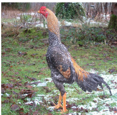
Fot. 10. Kogut rasy Shamo Photo 10. Shamo rooster (photos/salpicado)

zweżająca się w kierunku głowy. Pióra pokrywy grzywy są bardzo krótkie. Pierś duża, zaokrąglona i bardzo muskularna. Uda kur są średniej długości, muskularne, uwydartnione. Skoki barwy żółtej, średniej długości, mocne i grube. Masa ciała koguta wynosi 4 kg, kury 3 kg. Nieśność kur jest niewielka i wynosi około 50 jaj rocznie o masie 35–40 g. Jaja o jasnobrązowej skorupie są najczęściej znoszone wiosną i wczesnym latem.