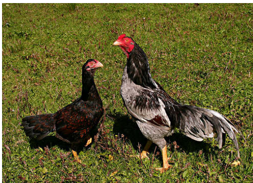
Fot. 1. Kura i kogut Asil Photo 1. Hen and rooster Aseel