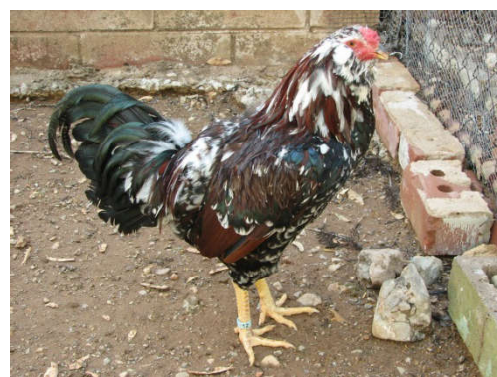
Fot. 8. Kogut bojowca orłowskiego Photo 8. Orloff rooster