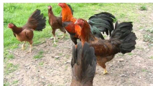
Fot. 9. Kury i kogut Satsumadori Photo 9. Hens and rooster Satsumadori