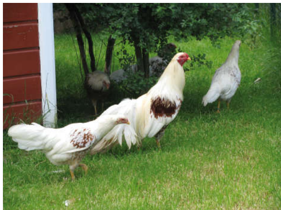
Fot. 13. Kogut i kury Yokohama Photo 13. Rooster and hen's Yokohama