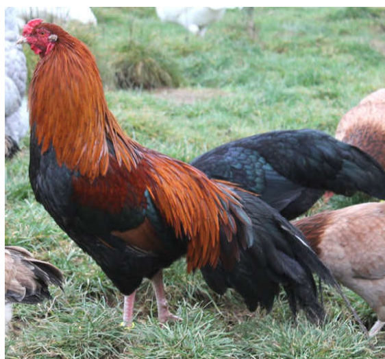
Fot. 6. Kogut Cubalaya Photo 6. Rooster Cubalaya