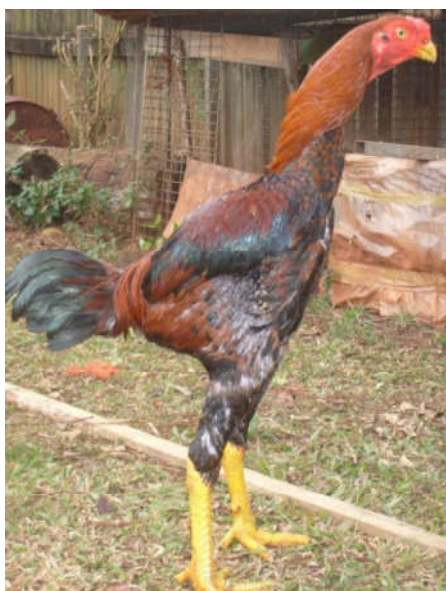
Fot. 3. Kogut bojowca malajskiego Photo 3. Rooster Malaya game fowl