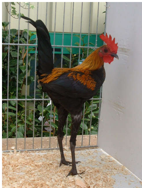
Fot. 4. Kogut bojowca nowoangielskiego Photo 4. Rooster newenglish game fowl

Pierwotnie rasa ta została wytworzona jako kury bojowe, wykorzystywane do walk kogutów na terenie Anglii. Po wprowadzeniu zakazu organizowania tych widowisk, rasa została przekształcona w kury wystawowe, o delikatniejszej budowie i sylwetce. W okresie swojej świetności była bardzo popularna i prawie powszechnie hodowana w całym Zjednoczonym Królestwie, po czym około roku 1910 nastąpił regres i znalazła się na skraju zagłady, gdy pozostało zaledwie 100 osobników (Schmidt, 2007). Dopiero na terenie Niemiec w 1967 r. nastąpił ponowny wzrost zainteresowania tą rasą i jej popularyzacja w całej Europie.