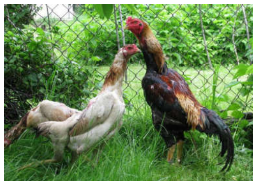
Fot. 7. Kury i kogut Koeyoshi Photo 7. Hen and rooster Koeyoshi (ptakiozdobne.pl)

mocne i grube, barwy jasnożółtej. Masa ciała dorosłego samca kształtuje się w zakresie 3–3,5 kg, kury 2,25–2,75 kg. Podstawową odmianą barwną jest porcelanowo-czerwona (fot. 8).