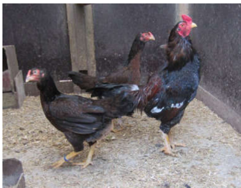
Fot. 2. Kury i kogut Madras Photo 2. Hen's and rooster Madras game fowl