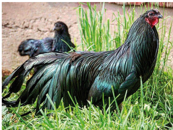
Fot. 11. Kogut rasy Sumatra Photo 11. Sumatra rooster

gruby, masywny, zagięty, czarny, na końcówce żółty. Czarne pióra pokrywające tułów powinny mieć bardzo intensywny zielonometaliczny połysk (fot. 11).