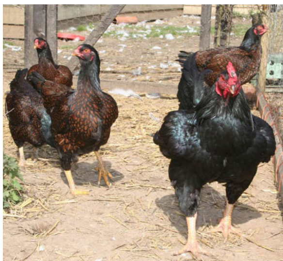
Fot. 5. Kogut i kury rasy Cornish Photo 5. Rooster and hens Cornish