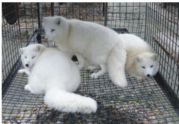
Lisy polarne białe