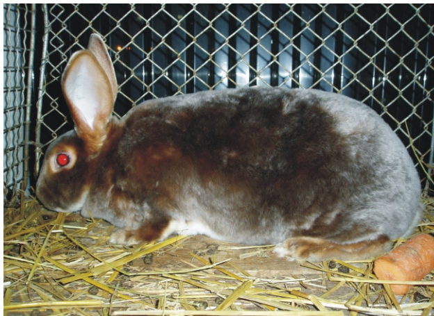
Królik Rex satynowy