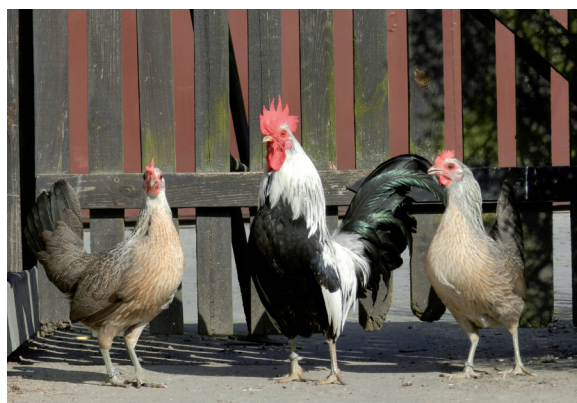
Fot. 16. Karzełki polskie odmiany srebrzystoszyjej Phot. 16. Polish bantams, silver neck variety