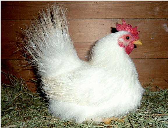
Fot. 10. Kura chabo – forma jedwabista Phot. 10. Chabo hen – silky form