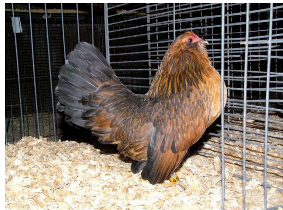
Fot. 5. Kura brodacza antwerpskiego – odmiana złocistoszyja Phot. 5. Antwerp Belgian Bantam hen – gold neck variety