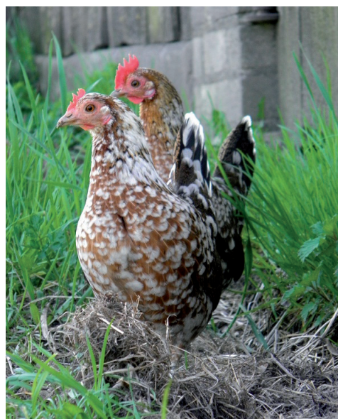
Fot. 18. Kurki karzełka polskiego odmiany pstrej Phot. 18. Polish bantams, spotted variety