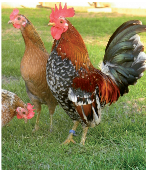
Fot. 17. Karzełki polskie odmiany kuropatwianej pstrej Phot. 17. Polish bantams, partridge spotted variety