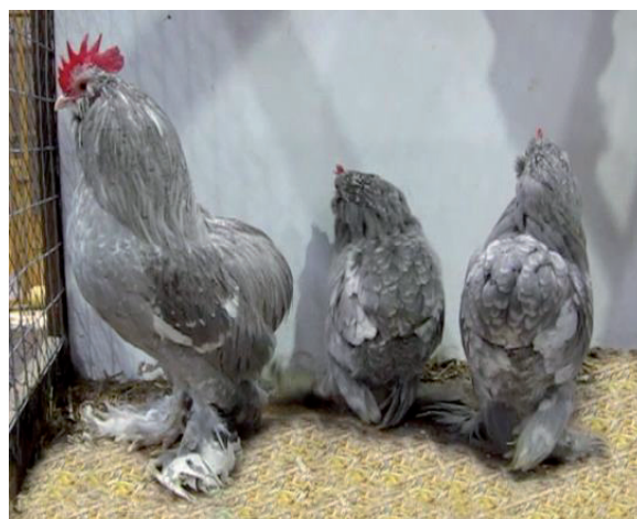
Fot. 20. Kury rasy rulanka (ruhlaer) Phot. 20. Ruhlaer hens

le cech karzełka łapciatego, jak opierzone skoki, nisko noszone skrzydła i typowa budowa ciała, jednak odróżnia ją osobliwa cecha, a mianowicie – podobnie jak u kur araucana i kaulhuhn – brak ogona (fot. 20). W literaturze nie ma dostępnych informacji na temat, czy faktycznie araucany brały udział w wytworzeniu tej rasy, jednak na podstawie tej cechy można wysnuć pewne przypuszczenia. Brak ogona i kuliste zakończenie grzbietu podkreśla obfite upierzenie siodła. Masa ciała dorosłego koguta wynosi 0,75 kg, kury 0,6 kg. Mimo osobliwego wyglądu rasa ta jest bardzo rzadko hodowana w Europie, poza ojczystym krajem tej rasy – Niemcami, gdzie znajduje się najliczniejsza jej populacja. W obrębie rasy występują liczne odmiany barwne w ilości 21.