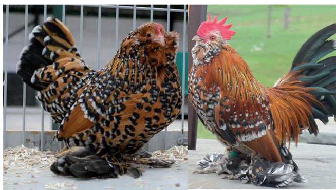
Fot. 13. Kura i kogut karzelka łapciatego Phot. 13. Mille Fleur bantam hen and rooster