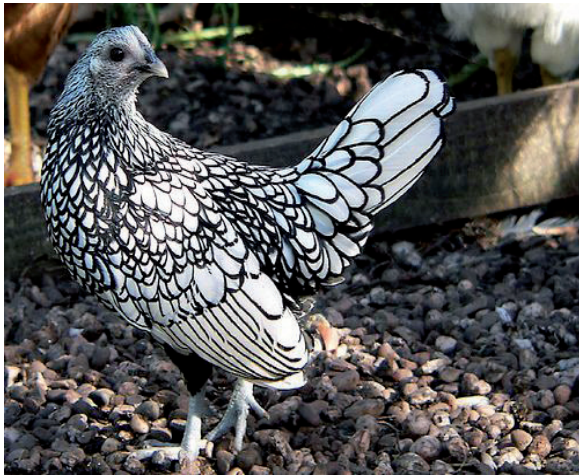
Fot. 21. Kura sebrityki – odmiana srebrzysta łuskowana Phot. 21. Sebright hen – silver-laced

Rasę charakteryzuje również ciekawy wzór upierzenia z tzw. łuskowaniem. Na krawędzi każdego z piór występuje czarna obwódka. W zależności od barwy piór wyróżnia się odmianę srebrzystą łuskowaną (fot 21), bądź złoci-