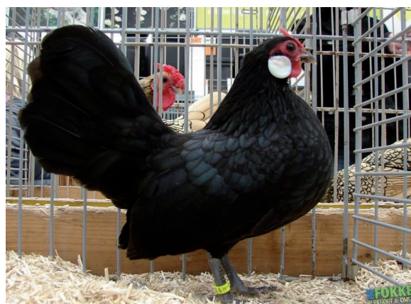
Fot. 2. Kura rasy bantamka – odmiana czarna Phot. 2. Bantam hen – black variety