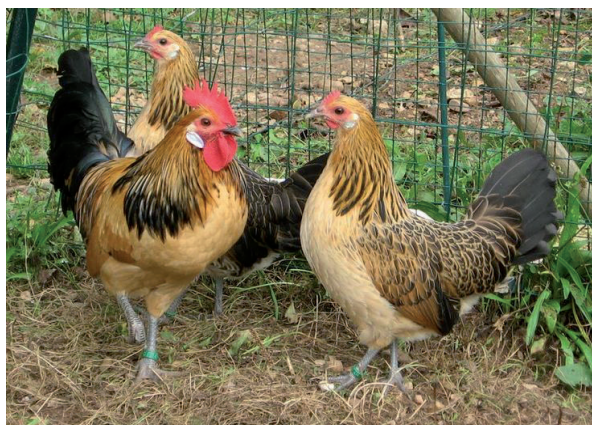
Fot. 3. Kogut i kury rasy bassette – odmiana przepiórcza Phot. 3. Bassette rooster and hen – quail variety