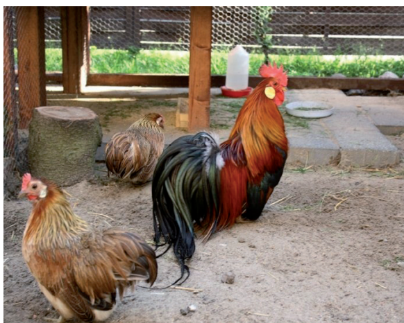
Fot. 19. Kogut i kury rasy ohiki Phot. 19. Ohiki rooster and hen

W tworzeniu tej rasy wykorzystano turyńskie brodacze miniaturowe, kaulhuhn i karzełki łapciate. Te ostatnie wniosły bardzo duży wkład w wygląd dzisiejszych rulanek, na co wskazuje duże podobieństwo obu ras. Rulanka posiada wie-