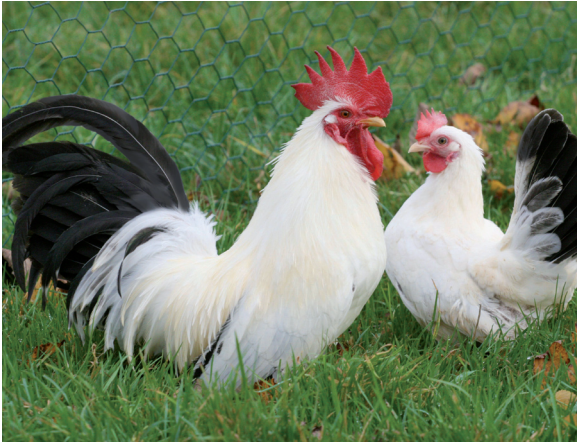
Fot. 8. Kogut i kura rasy chabo Phot. 8. Chabo rooster and hen