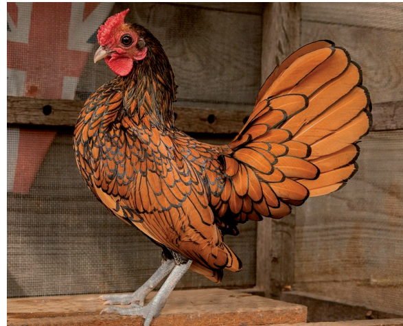
Fot. 22. Kogut sebrityki – odmiana złocista łuskowana Phot. 22. Sebright gold-laced rooster (pinterest.com)

stą łuskowaną (fot. 22). Oprócz wspomnianych najpopularniejszych odmian barwnych sebrityki występują również: cytrynowa o odcień jaśniejszy niż złocista łuskowana oraz tzw. wielbłądzia, która zamiast czarnego łuskowania ma obwódkę piór białego koloru. Pomimo małych rozmiarów kury i koguty tej rasy mają czupurny i zadziorny charakter i są zazwyczaj utrzymywane w niewielkich stadkach hodowlanych złożonych z koguta i 2–5 kur.