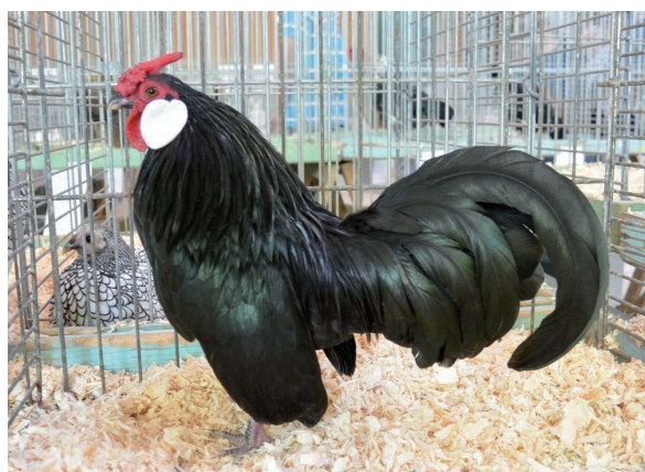
Fot. 1. Kogut rasy bantamka – odmiana czarna Phot. 1. Bantam rooster – black variety

ga masę ciała 600 g, kura 500 g. Sylwetka jest smukła, a osobniki cechuje krótki grzbiet oraz uwydatniona i wypięta do przodu pierś (Knaga i Kasperek, 2014). Skrzydła przylegają do tułowia i są stosunkowo nisko noszone, końcówki lotek niemal dotykają podłoża (Schmidt, 2007). U koguta sierpówki ogona powinny być zaokrąglone, tworząc jego charakterystyczny kształt (fot. 1), u kury natomiast ogon jest kształtu wachlarza (fot. 2). U obu płci jest on stosunkowo wysoko noszony. Skoki są krótkie i nieopierzone, barwy sinoniebieskiej. Głowa jest mała i smukła. U tej rasy występuje tylko i wyłącznie grzebień różyczkowy, sprawiający wrażenie lekko cofniętego do tyłu, z widocznym kolcem. Zausznice są duże, mięsiste i bardzo wydatne, barwy śnieżno-białej (Kruszewicz i Tarasewicz, 2002). Do najczęściej spotykanych wad u tej rasy zalicza się małe zausznice, częściowo czerwone lub niebieskie zamiast czysto białych. Najpopularniejszą odmianą barwną w tej rasie jest czarna. Zarówno koguta, jak i kurę powinno cechować wyłącznie czarne upierzenie o metalicznym, zielonym połysku. Obecnie przedstawiciele tej rasy występują w znacznie liczniejszych odmianach barwnych, takich jak: biała, jastrzębiata, niebieska, kuropawiana, kolumbijska. Jaja znoszone przez kury mają masę 35 g i białą skorupkę.