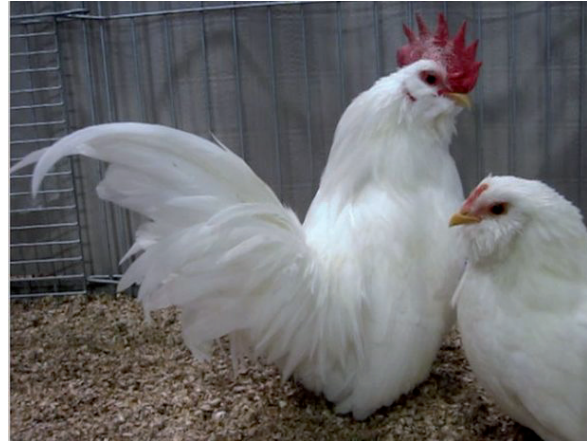
Fot. 11. Para kur chabo okina Phot. 11. Chabo Okina couple

holenderskich właścicieli ziemskich ze względu na żywy temperament i małe rozmiary ciała. Obecnie kury tej rasy rozpowszechniły się w całej Europie, jak i poza nią, szczególnie w Stanach Zjednoczonych i Kanadzie. Pierwszy ich import do Wielkiej Brytanii miał miejsce w latach 70. XX w. Wkrótce zyskały one tam dużą popularność i w Wielkanoc 1982 r. powstał tam klub hodowców karzełka holenderskiego. Kurki tej rasy znoszą około 100 jaj rocznie i wykazują silny instynkt kwoczenia. Cechuje je bardzo harmonijna budowa i dumna postawa ciała. Głowa jest stosunkowo mała z prostym grzebieniem o 5–6 ząbkach. Zausznice są małe, barwy białej. Pierś jest lekko wypięta do przodu, jednak nie ponad linię grzbietu, która jest lekko wklęsła. Ogon jest