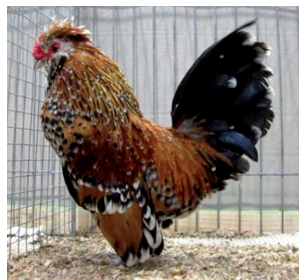
Fot. 6. Kogut brodacza watermalskiego – odmiana porcelanowa Phot. 6. Barbu de Watermael rooster – porcelain variety