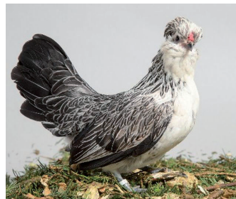
Fot. 7. Kura brodacza watermalskiego – odmiana srebrna przepiórcza Phot. 7. Barbu de Watermael hen – silver quail variety