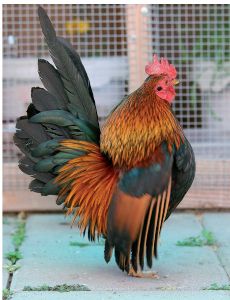
Fot. 23. Kogut rasy serama Phot. 23. Serama rooster

W 1990 r. w północnej części Malezji odbył się pierwszy pokaz tych ptaków. Demonstrowane było pianie oraz walki kogutów. Obecnie