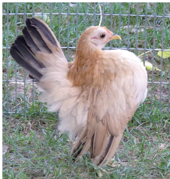
Fot. 24. Kura rasy serama Phot. 24. Serama hen

na wystawach zwraca się większą uwagę na ich odmiany barwne. Ich hodowla rozprzestrzeniła się na Indonezję, Tajlandię i Singapur. W 2001 r. trafiły do USA, a w 2004 do Wielkiej Brytanii. Rasa ta pojawiła się następnie w Holandii i krajach ościennych, zdobywając coraz większą popularność w Europie.