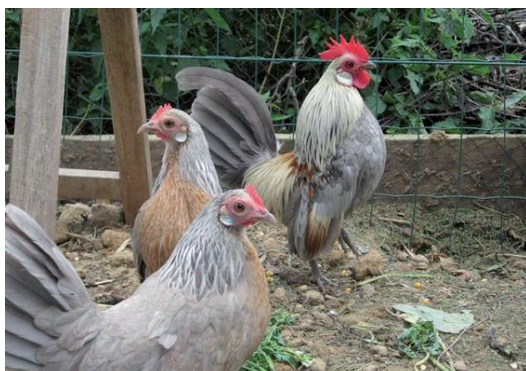
Fot. 12. Karzelki holenderskie Phot. 12. Dutch bantams

niki tej rasy mają harmonijną budowę. Szyja jest średniej długości i łagodnie przechodzi w tułów dzięki obfitemu upierzeniu. Uznaje się, że głowa, szyja oraz tułów powinny tworzyć kształt liry (Schmidt, 2007). Skrzydła są skierowane lekko ku dołowi, jednak ich końce nie powinny dotykać podłoża. Obecnie wyróżnia się dwa warianty tej rasy – z brodą lub bez brody. U koguta sierpówki ogona powinny być sztywne i proste, przekraczając swoją długością sterówki. Również u kury ogon powinien być noszony wysoko w kształcie wachlarza. Masa ciała koguta wynosi 0,75 kg, kury 0,6–0,65 kg. Najpopularniejszymi odmianami barwnymi tej rasy są: porcelanowa, porcelanowa izabelowata, porcelanowa niebieska, porcelanowa cytrynowa, a także czarna, bia-