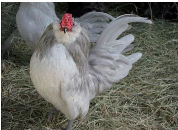
Fot. 4. Kogut brodacza antwerpskiego – odmiana lawendowa Phot. 4. Antwerp Belgian Bantam rooster – lavender variety (backyardchickens.com)

wej i pewnych podobieństw w budowie ciała obie rasy brodaczy są często ze sobą mylone. Istnieją pomiędzy nimi jednak istotne cechy odróżniające. U brodacza watermalskiego przede wszystkim występuje niewielki czub na głowie, którego brak jest u brodacza antwerpskiego. Jest to rasa mniej popularna niż pokrewny wąsacz antwerpski. Kury i koguty brodacza watermalskiego osiągają podobną masę ciała. Postawa ciała poprzez mocno wysklepioną do przodu, zaokrągloną pierś sprawia wrażenie dumnej i zadziornej. Skrzydła są dość szerokie i długie, opadają ku dołowi. Krótki i szeroki tułów nieco zwęża się ku ogonowi. Ogon średniej długości z szerokimi sterówkami, lekko zagiętymi sierpówkami głównymi i bocznymi. Skoki są barwy szaroniebieskiej do grafitowej w zależności od odmiany barwnej. Uda obficie opierzone, krótkie i mocno umięśnione. Głowa duża i okrągła z czubem opadającym do tyłu. Zarówno kury, jak i koguty posiadają bujną i dużą brodę. Grzebień różyczkowy u koguta jest dość duży i szeroki, u kury niewielki. Dzwonki i zausznicze czerwone, zakryte brodą. Część twarzowa czerwona. Broda nie powinna zakrywać oczu, które są brązowe (Schmidt, 2007). Kury znoszą rocznie 100–120 jaj o barwie białokremowej i masie 35 g. W obrębie rasy występują 33 odmiany barwne, jednak najpopularniejsze są: porcelanowa (fot. 6), przepiórcza, niebiesko-przepiórcza i srebrzysto-przepiórcza (fot. 7).