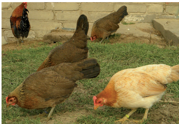
Fot. 15. Kury karzełka polskiego – złocistoszyja (po lewej) i pszeniczna (po prawej) Phot. 15. Polish Bantam hens – golden neck (left) and wheat varieties (right)