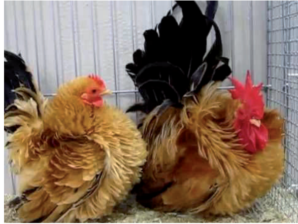
Fot. 9. Para kur chabo – forma szurpata Phot. 9. Chabo couple – frizzle form