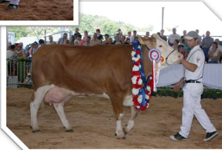
Krowa Cindy – super czempion Wystawy, hod. SK Pępowo Cow Cindy – super champion of the Exhibition, breeder SK Pępowo