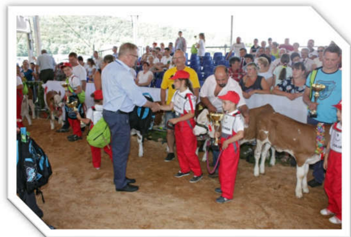
Nagrody w „Konkursie Młodego Hodowcy” Prizes in the „Young Breeders Competition”