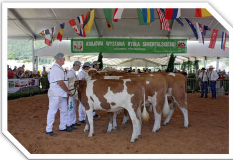
Ocena jałówek Assessment of heifers