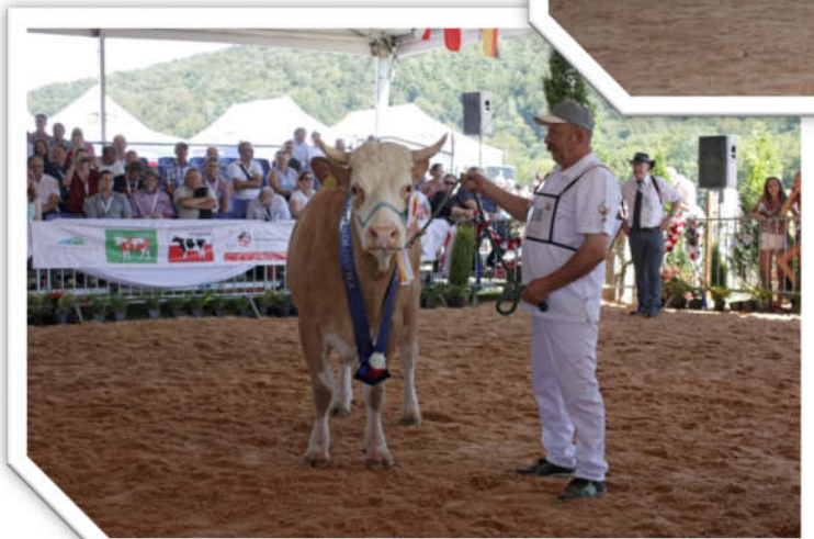
Krowa Bryza – czempion, hod. ZD IZ PIB Odrzechowa Cow Bryza – champion, breeder NRIAP Experimental Station Odrzechowa