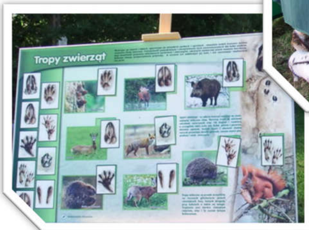
Stoisko edukacyjne Nadleśnictwa Rymanów Educational stand of the Rymanów Forest Inspectorate