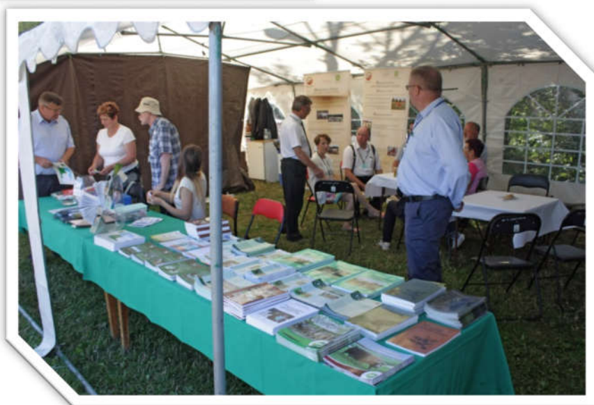
Stoisko informacyjne IZ PIB Information stand of the NRIAP