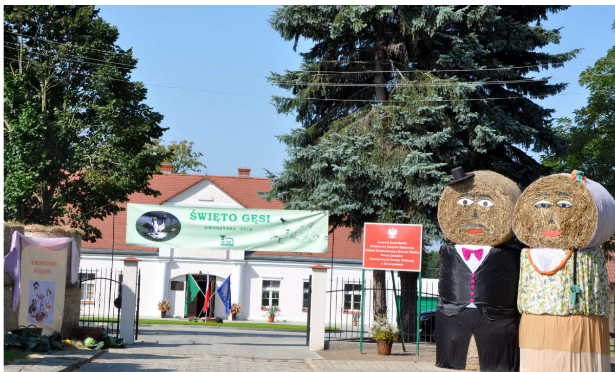
Fot. 1. Dożynkowa dekoracja SZGDW w Dworzyskach w dniu „Święta Gęsi” (fot. E. Gornowicz)

dwunastu stad objętych programem ochrony zasobów genetycznych zwierząt w SZGDW w Dworzyskach. Wraz z nastającymi krótszymi dniami gęsi stopniowo kończyły okres swojej produkcji nieśnej i w zakładach wylęgowych w Dworzyskach oraz Kołudzie Wielkiej przeprowadzono ostatnie wylęgi gąsiąt. Okres zakończenia produkcji nieśnej gęsi skłania do przeprowadzenia oceny ekonomicznej sezonu i podsumowania spraw organizacyjno-hodowlanych.