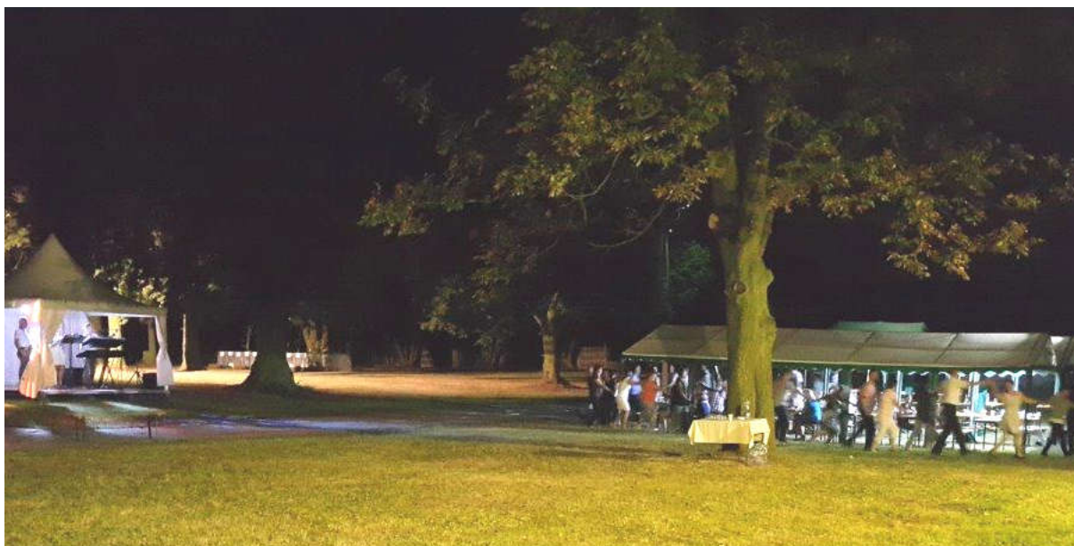
Fot. 10. Takiej scenerii w SZGDW w Dworzyskach dotychczas nie było

Dożynki to dziękczynienie za plony, także te uzyskane w produkcji zwierzęcej oraz radość z owoców ciężkiej pracy.