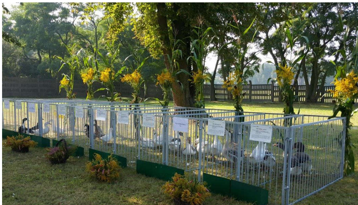
Fot. 9. Pary wybranych ras kaczek i gęsi

czej scenerii parku okalającego Dworek w Dworzyskach, wystawa kaczek i gęsi wybranych ras tu utrzymywanych (fot. 9).