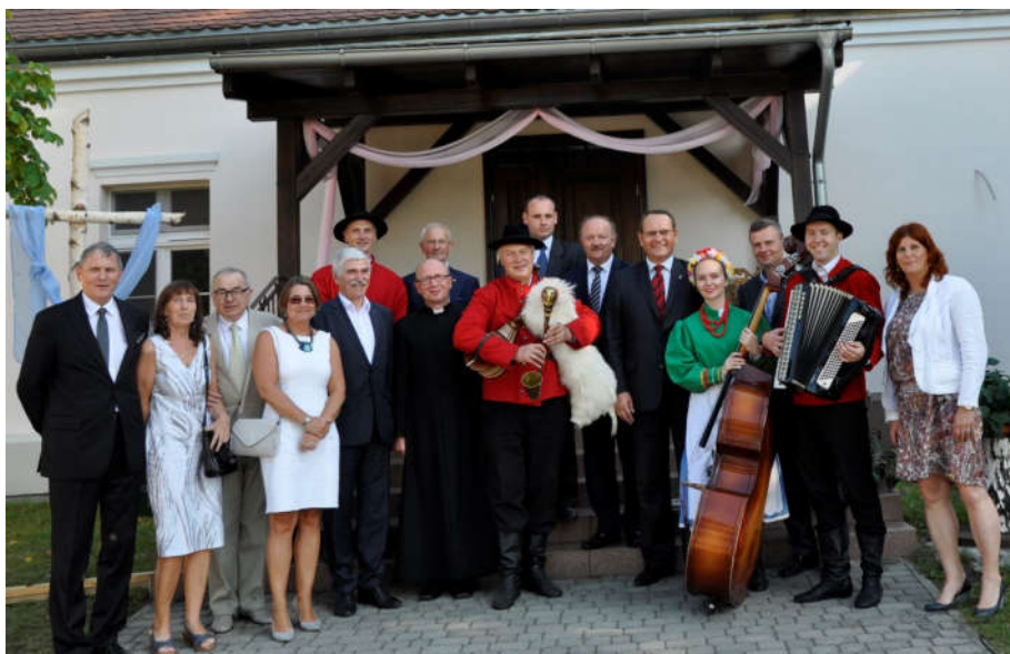
Fot. 2. Pamiątkowe zdjęcie uczestników „Święta Gęsi”