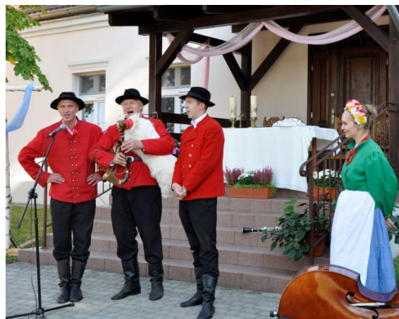
Fot. 7. Zespół Pieśni i Tańca „Wiwaty” przybliżył folklor wielkopolski w strojach, śpiewie i tańcu