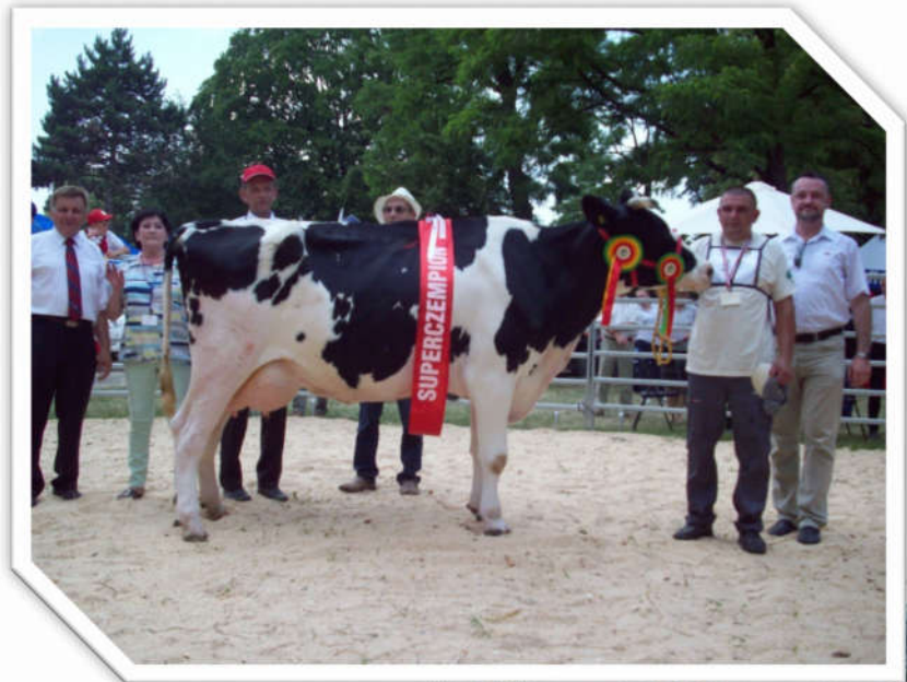
Krowa Kejti – super czempion, hod. A. Paško z Glinika