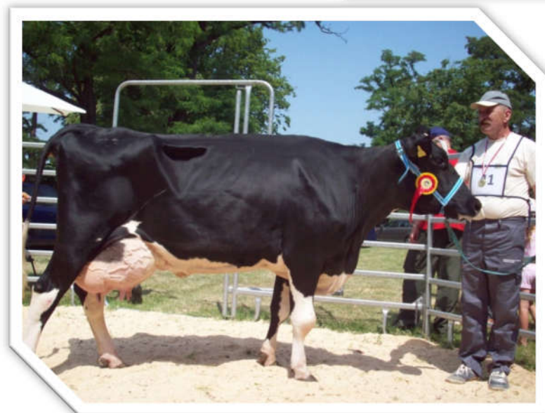
Krowa Owacja – wiceczempion, hod. ZD IZ PIB Chorzelów. Puchar za najlepszą wydajność za 305 dni laktacji: 13 865 kg mleka – 4,36% tłuszczu – 3,26% białka