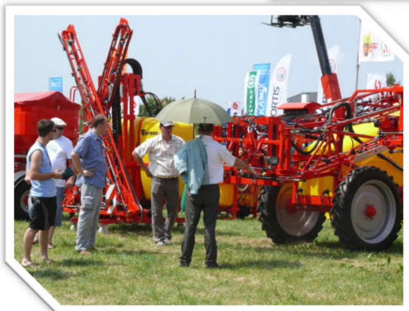
Stoiska maszyn rolniczych budzą zawsze duże zainteresowanie