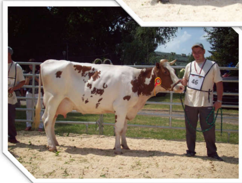
Krowa Unia – wicczempion, hod. M. Siry z Dynowa