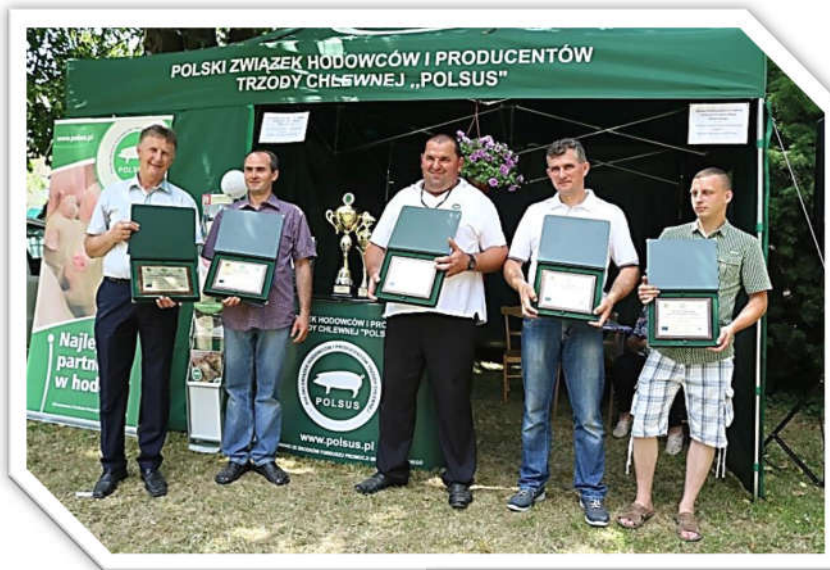
Hodowcy świń z nagrodami