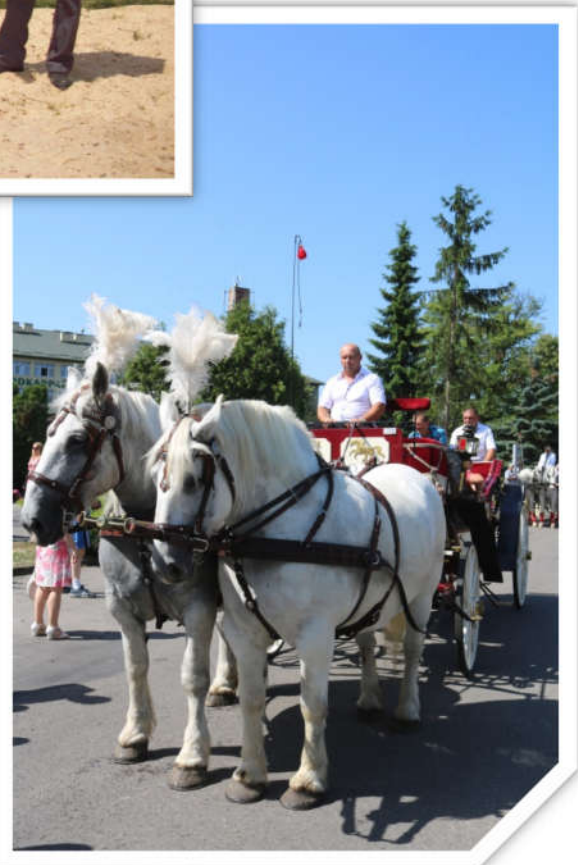
Prezentacja koni w zaprzęgu