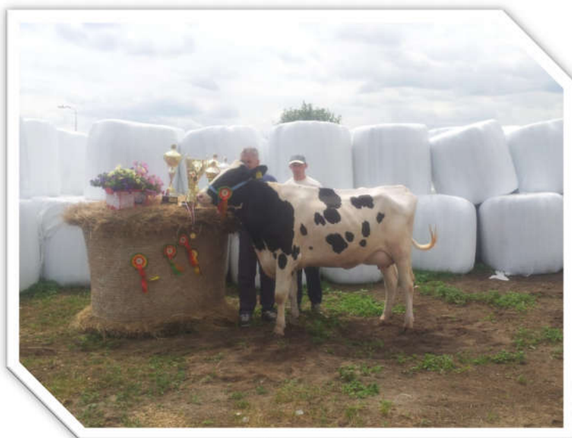
Krowa Sara – czempion, hod. ZD IZ PIB Chorzelów.