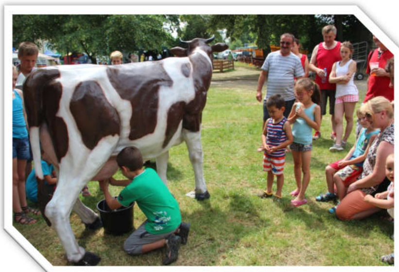
Konkurs dojenia krowy