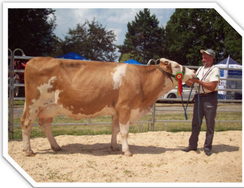
Simental to mięso i mleko