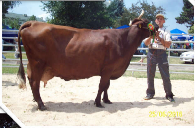
Krowa Kora – czempion, hod. G. Sowy z Kąkolówki