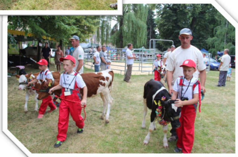
Konkurs Młodego Hodowcy