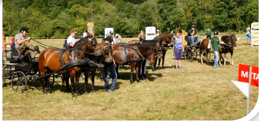
Nagradzanie zaprzęgów, od lewej: III, II i I miejsce