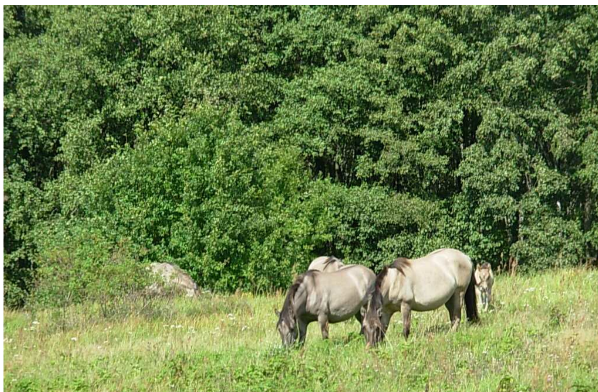
Fot. 1. Konie to jeden z gatunków zwierząt gospodarskich najczęściej spotykanych w gospodarstwach agroturystycznych

Phot. 1. One of the livestock species most frequently kept in agritourism farms are horses