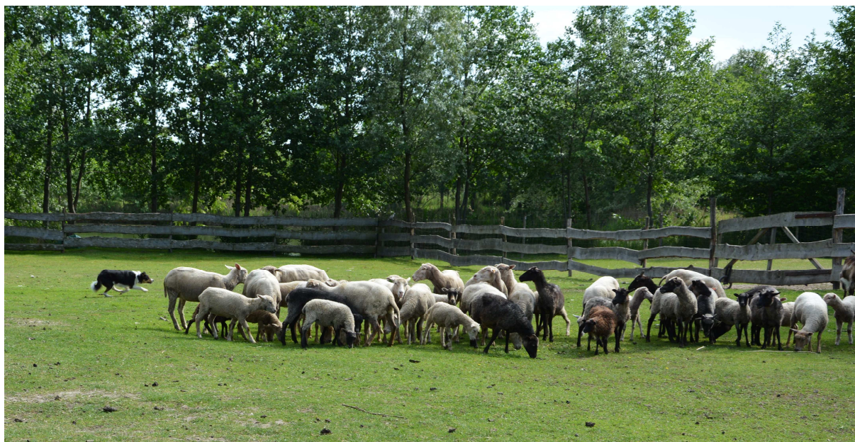
Fot. 2. Psy pasterskie w akcji Phot. 2. The herding dogs in action

Agroturystyka jest szansą na powrót do tradycyjnego rolnictwa, w którym chów zwierząt gospodarskich odbywa się w zgodzie z ich rytmem biologicznym, a także respektowane i zaspokajane są ich potrzeby życiowe. Zwierzęta są utrzymywane w warunkach zbliżonych do naturalnych.