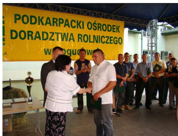
Wręczenie nagród hodowcom