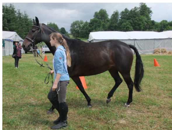
Klacz rasy małopolskiej – Piratka i Botanika