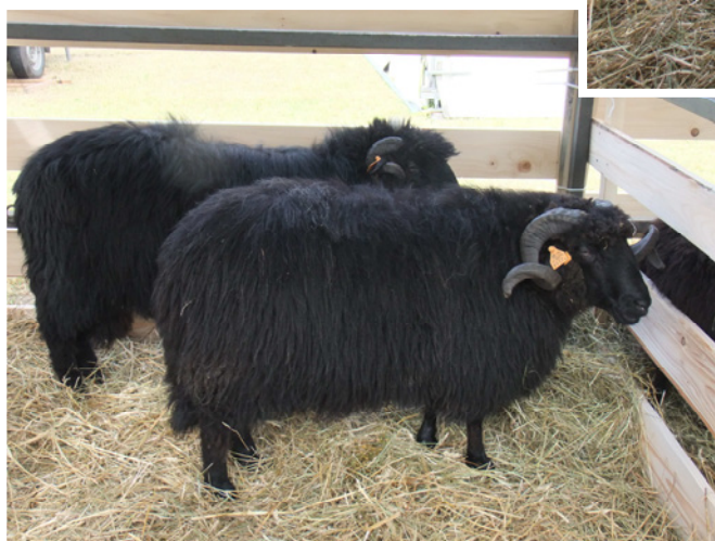
Polska owca góraska odmiany barwnej