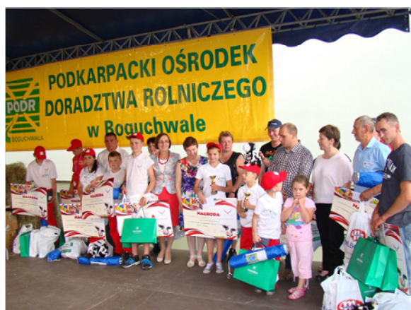
Młodzi hodowcy z rodzicami – i z nagrodami