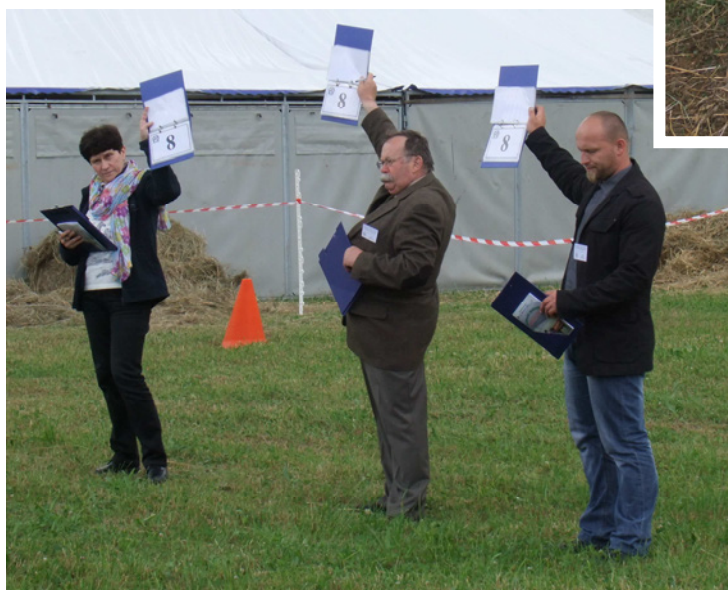
Bardzo dobra zgodność Komisji w ocenie