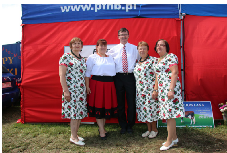
Miłe Panie dbały o gastronomię dla organizatorów i gości