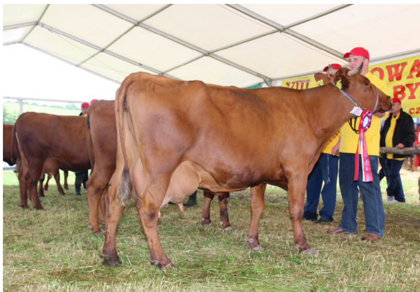
Super czempion Wystawy – krowa Centuria 1 (z programu ochrony zasobów genetycznych) z obory J. Króla z Męciny