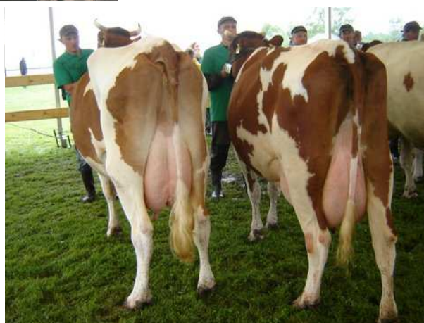
Bardzo ładne wymiona (phf odm. czb)