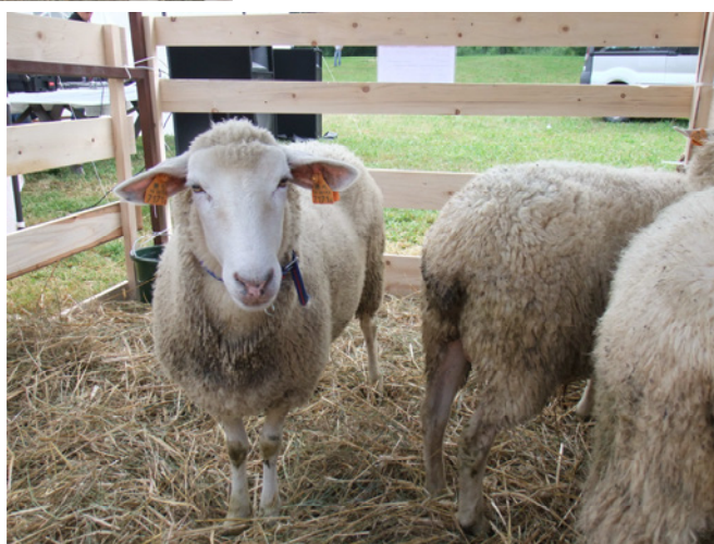
Polska owca pogórza