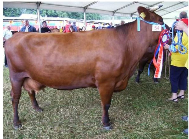
Krowa Pola – czempion w kat. krów w II i III laktacji (program ochrony zas. genet.), z OHZ Przerzeczyn Zdrój