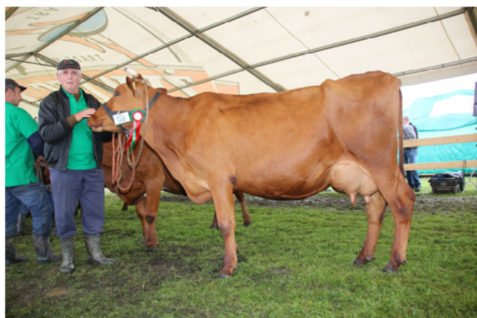
Wicieczempion w rasie polskiej czerwonej – krowa Bija z hod. J. Solarczyka z Wróblówki