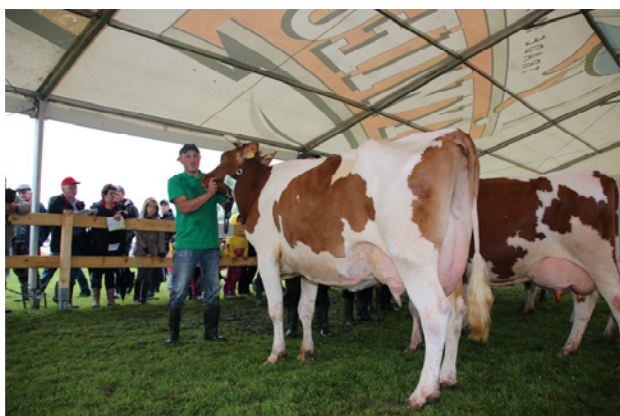
Czempion wśród krów rasy PHF odmiany czb – Jagódka 2 z obory S. Zająca z Działu