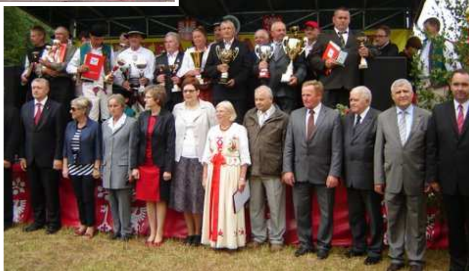
Wyróżnieni hodowcy z organizatorami i gośćmi