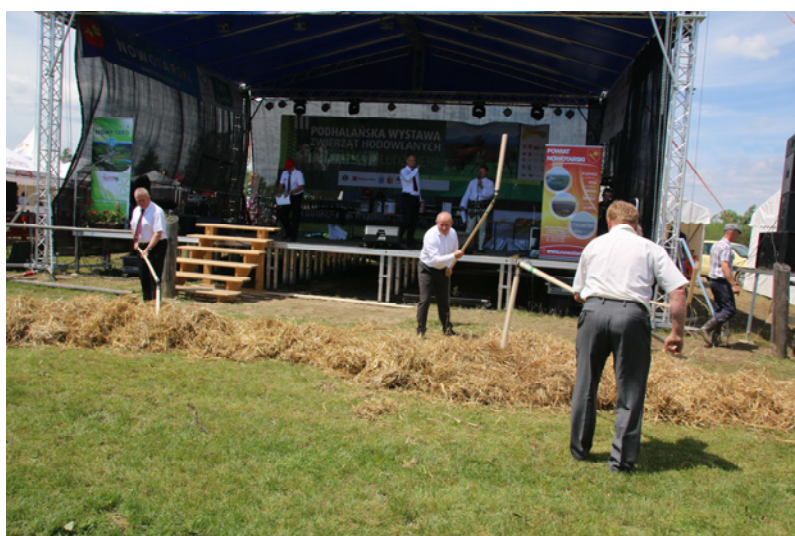
Konkurs młócenia żyta cepami