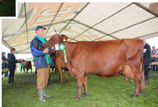
Czempion w rasie polskiej czerwonej – krowa Wera z obory W. Łukasza z Krempachów