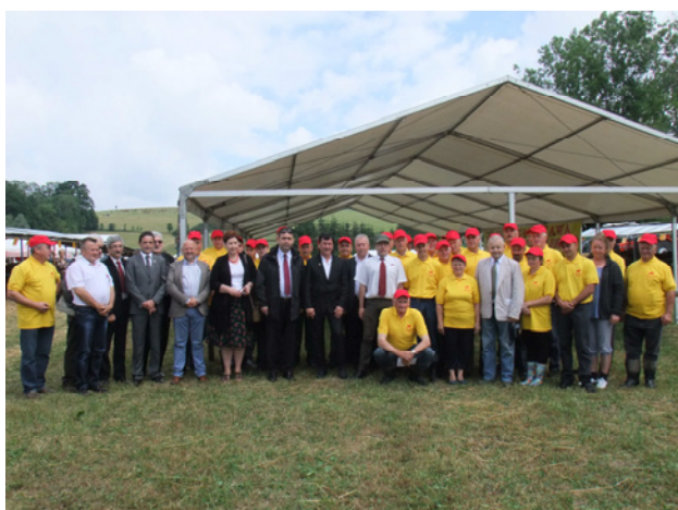
Wystawcy i organizatorzy