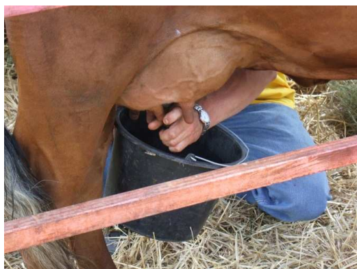
Stąd bierze się mleko!