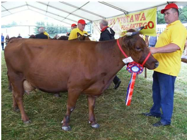
Krowa Bystra – czempion w kat. krów w IV i V laktacji (program ochrony zas. genet.), z obory P. Smagi ze Stróży