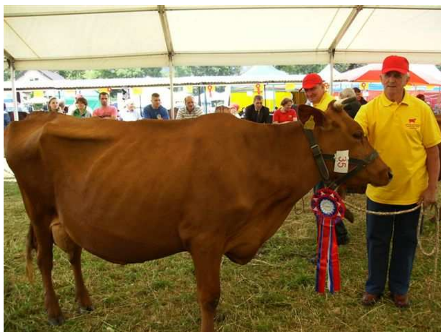
Super czempion Wystawy – krowa Bija (z programu doskonalenia rasy) z obory J. Solarczyka z Wróblówki