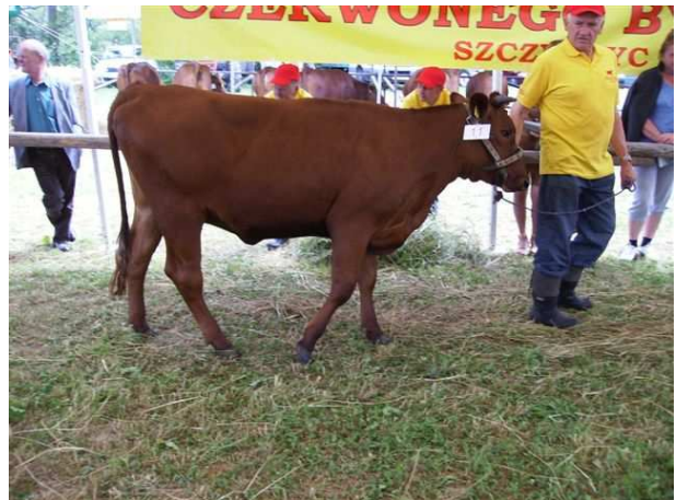
Jałówka Żanet – czempion w kat. jałowic w wieku 17–20 mies., z hod. M. Stasika z Mochnaczki Wyżnej