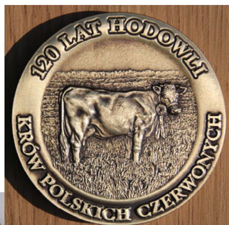
Medal KZHCBP i PFHBiPM

Mleka , a także różnych małych i większych sponsorów oraz z Urzędu Gminy Jodłownik i Urzędów: Marszałkowskiego i Wojewódzkiego w Krakowie.