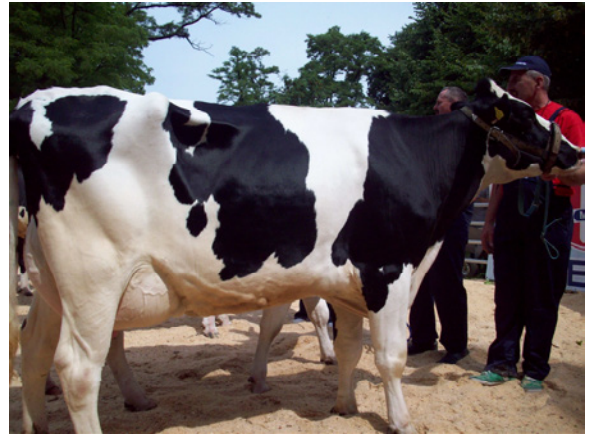
Czempion w grupie krów pierwiastek rasy PHF odmiana cb – krowa Żegotka z hod. ZD IZ PIB w Chorzelowie