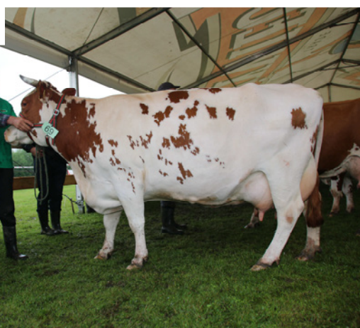
Czempion wśród krów rasy polskiej czerwono-białej – Biała z obory S. Lichosyta z Jabłonki