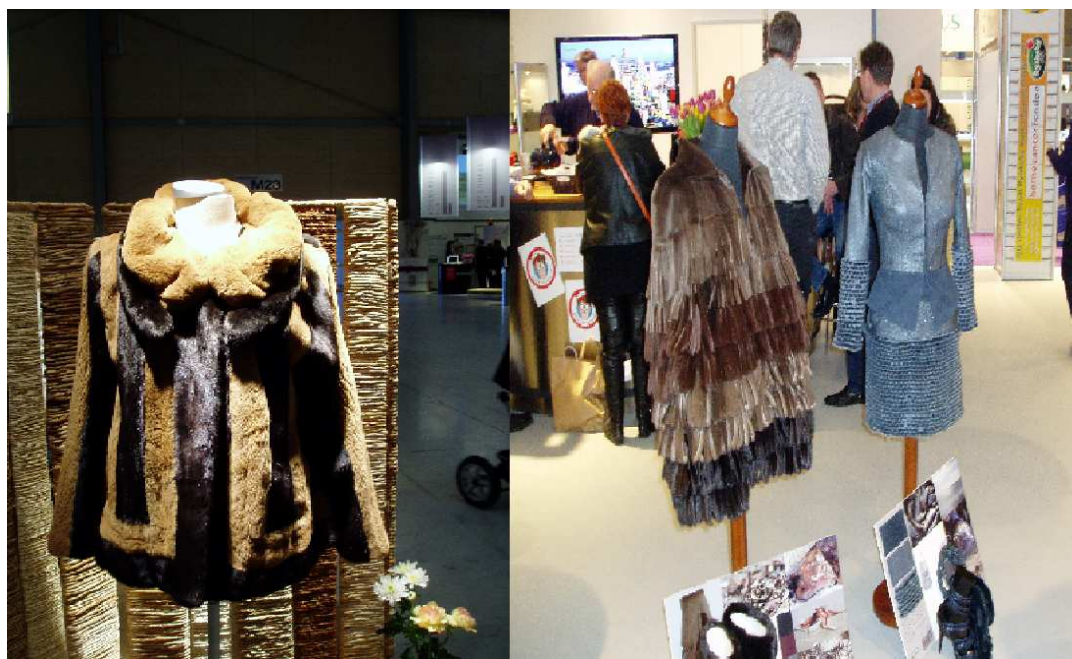
Fot. 5. Pokaz wyrobów skórzanych w Herning (Dania) Photo 5. A show of leather products in Herning (Denmark)