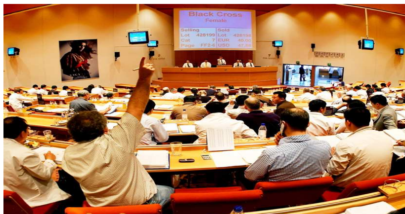
Fot. 2. Aukcja skór w Helsinkach – Photo 2. A skin auction in Helsinki