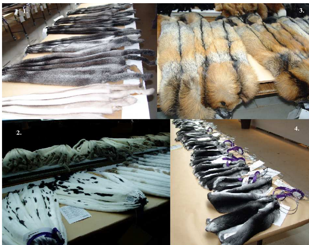
Fot. 4. Pokaz skór w Herning (Dania): 1, 2 – norki, 3 – lisy, 4 – szynszylki Photo 4. A show of skins in Herning (Denmark): 1, 2 – mink, 3 – fox, 4 – chinchilla