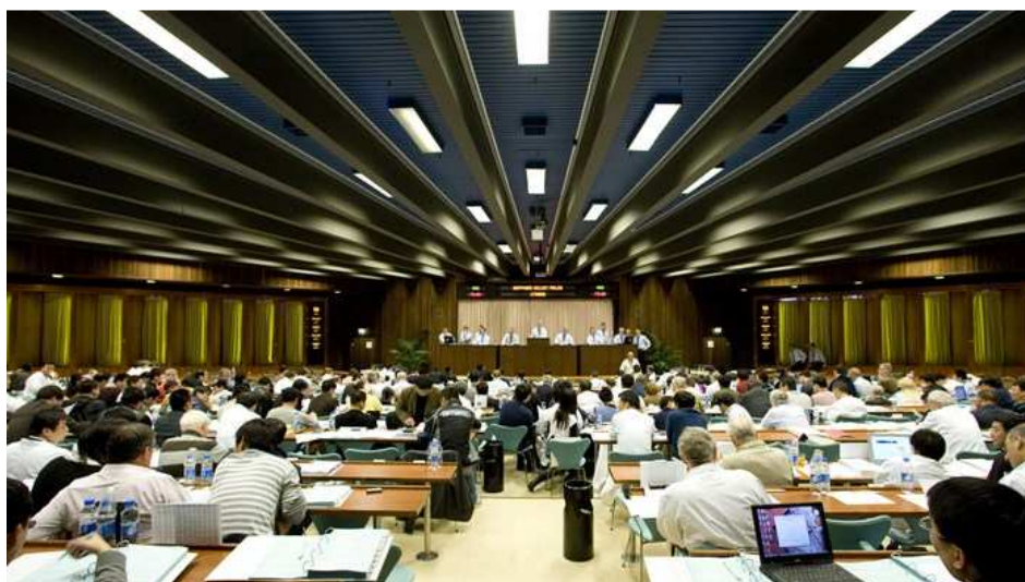
Fot. 1. Aukcja skór futerkowych w Kopenhadze – Photo 1. A furskin auction in Copenhagen

stąpił upadek państwowych firm, zajmujących się produkcją wyrobów futrzarskich. W tym okresie nastąpiła również ogólnoświatowa bessa na skóry surowe, co w konsekwencji doprowadziło do likwidacji małych, przydomowych ferm hodowlanych. Czas kryzysu przetrwały tylko większe fermy, głównie lisów pospolitych i norek. Zgodnie z trendami panującymi na światowych rynkach, które preferują skóry krótkowłose, coraz więcej hodowców prowadzi na fermach prace hodowlane w kierunku poprawy okrywy włosowej.