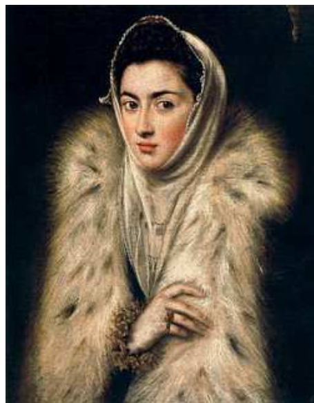
El Greco – Dama w etoli El Greco – Lady in a fur wrap