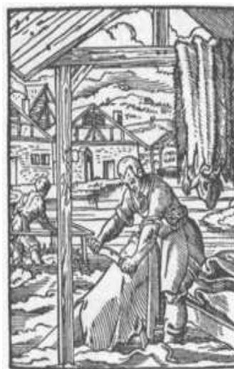
Ryc. 1. Kuśnierz z VI w.

W XVIII w. Polska prowadziła handel futrami głównie z Lubeką, a dawni kuśnierze zajmowali się nie tylko szyciem futer, ale także wyprawianiem skór.