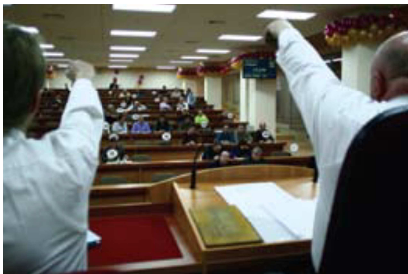
Fot. 3. Sala aukcyjna w Sankt Petersburgu – Photo 3. Auction hall in St Petersburg

Nikt nie spodziewał się tak dużego zainteresowania skórami zwierząt futerkowych, jaki zaobserwowali fachowcy w ostatnich latach na aukcjach w Helsinkach i Kopenhadze (Gołąbek, 2012). Świadczy o tym nie tylko wzrost bądź utrzymanie wysokiego pułapu cen, ale także niemal 100% sprzedaż oferty domów aukcyjnych. Pomimo że w ciągu roku, pomiędzy aukcjami ceny skór mogą różnić się nawet o 40%, to i tak każda ich ilość znajduje teraz nabywców, a cena nie gra roli.