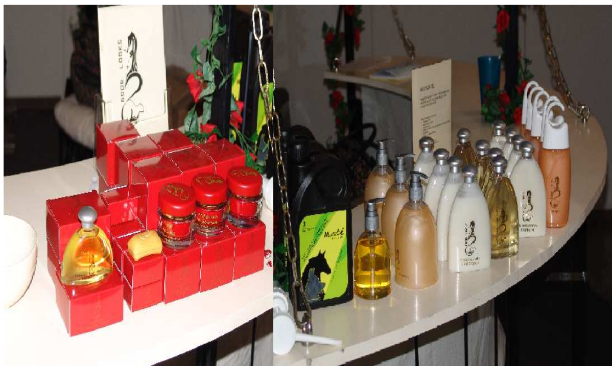
Fot. 7. Kosmetyki z dodatkiem tłuszczu norczego Photo 7. Cosmetics with mink fat