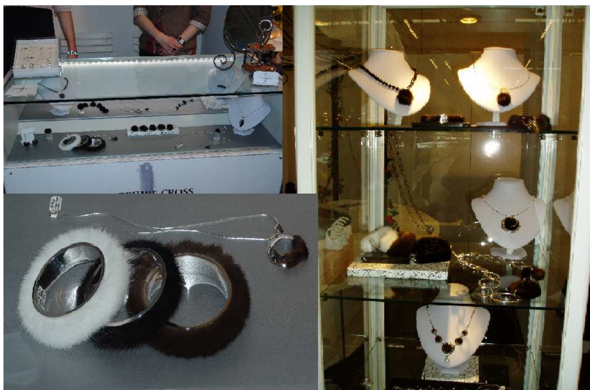
Fot. 6. Bizuteria ze skór norczych na pokazie w Herning (Dania) Photo 6. Jewellery from mink skins at a show in Herning (Denmark)