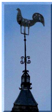
Rys. 3. Kogut z wieży kościelnej Fig. 3. Church tower rooster

Z kolei, pióra, grzebień, krew, kości, wnętrzności poświęcano bóstwom urodzaju i płodności, aby przeciwdziałać zarazie, przyspieszyć nadejście wiosny czy pobudzać wegetację zbóż. Relikty takich obrzędów odnajdujemy u Słowian, którzy grzebali tego ptaka pod fundamentami budynków, aby chronić je i strzec przed złymi mocami. Funkcje apotropiecznej takiej daniny łączyły się z próbami zapewnienia sobie powodzenia na przyszłość. Podobnie można tłumaczyć obecność metalowych kogutów na dzwonicach (rys. 3).