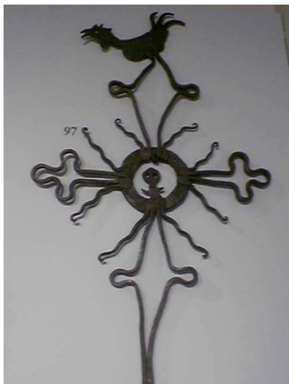
Rys. 5. Kogut wieńczący krzyż przydrożny Fig. 5. Rooster crowning a roadside cross

W naszych rodzimych podaniach i baśniach ludowych: „na odgłos piania koguta uchodzą z ziemi wszystkie złe duchy, strachy i upiory, tracąc równocześnie swą moc i zdolność szkodenia ludziom, których nawiedziły” (Gajek, 1934), a w przysłowia: „Pokusy władzy nie mają, gdy już koguty śpiewają” i „Kiedy kur pieje, diabeł truchleje”.