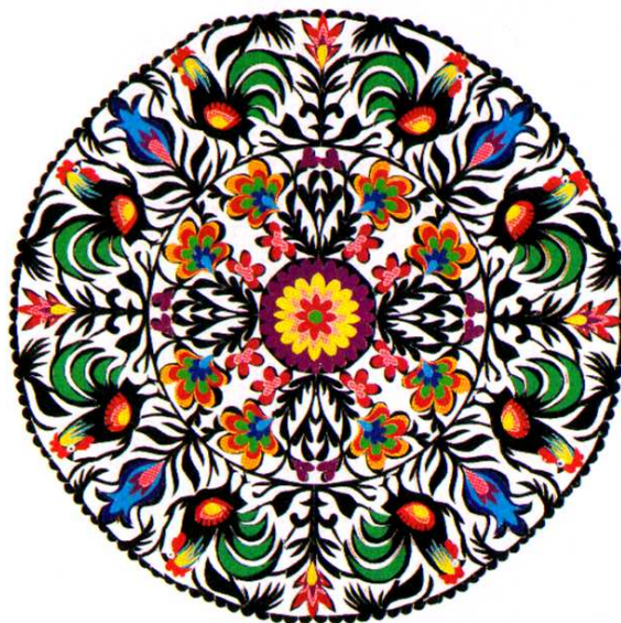
Rys. 7. Ażurowa wycinanka łowicka Fig. 7. Open-work paper cut from Łowicz

Niekiedy korzystano z kogucich właściwości nie tylko za pomocą wizerunku, ale także z wykorzystaniem fragmentów ciała. Wierzono, że prawa noga tego ptaka pomaga mężczyźnie zwyciężyć przeciwnika, a jego grzebień z dodatkiem wonnego ziela i odrobiny startego rogu