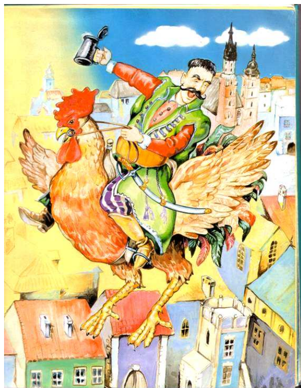
Rys. 8. Ilustracja do bajki Pan Twardowski Fig. 8. Illustration for the fable Pan Twardowski (Jacek Dalibor)

Do bardzo ciekawych należy motyw jazdy, podróży na kogucie . Według wierzeń ludowych na kogucie jeździli Faust i sam Mistrz Twardowski (rys. 8).