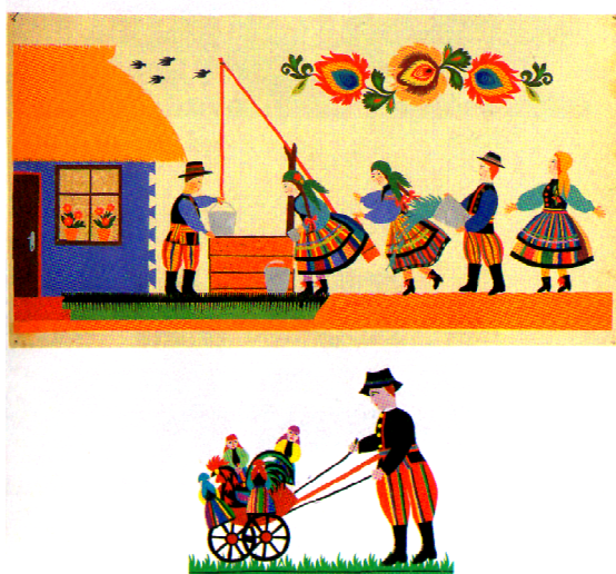
Rys. 4. Kurek dyngusowy, wycinanki łowickie Fig. 4. Easter Monday cockerel, folk art papers cut from Łowicz

Najpopularniejszym zwyczajem w Polsce było chodzenie z kogutkiem, czy też „ kurem dyngusowym ”. Z tym symbolem płodności, jurności obchodzono przede wszystkim domy, w których były młode dziewczęta (rys. 4).