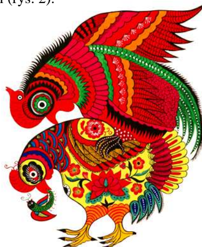
Rys. 2. Kogut jako symbol płodności Fig. 2. Rooster as a symbol of fertility

Kogut ściśle łączy się z symboliką życia i narodzin, a co za tym idzie, także z symboliką płodności (rys. 2).