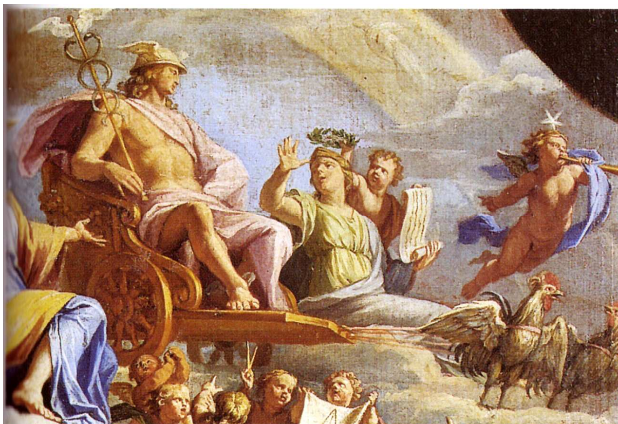
Rys. 1. Merkury na wozie ciągniętym przez dwa koguty Fig. 1. Mercury chariot drawn by two roosters (Jean-Baptiste de Champaigne, 1672)

Kogut jest również symbolem czujności – ze względu na bliski związek z budzącym się dniem. Wstaje, by pisać jeszcze w ciemnościach, gdy wszyscy śpią.