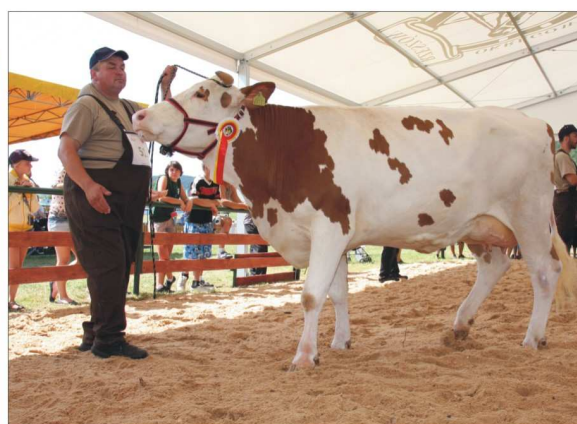
ŁANIA z hodowli W. Proroka z Trześniowa – czempion wśród krów pierwiastek