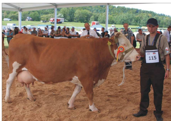
BIANKA z hodowli R. Walczaka z Jasienicy Rosielskiej – wiceczempion wśród krów-seniorek