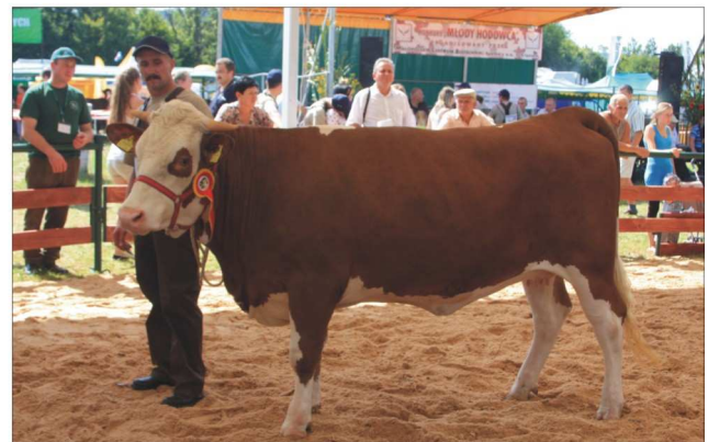
KOLI z hodowli K. Sokołowskiego z Jabłonki – wiceczempion wśród jałówek cielnych w wieku 20-23 mies.