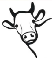
MALINA z hodowli R.M. Węgrzyniaków z Pakosówki – superczempion wśród jałówek