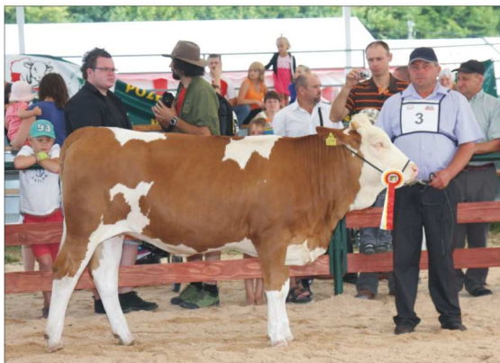
MARLENA z hodowli G.S. Czapl z Nagórzan – czempion w kategorii jałowic w wieku 12-15 mies.