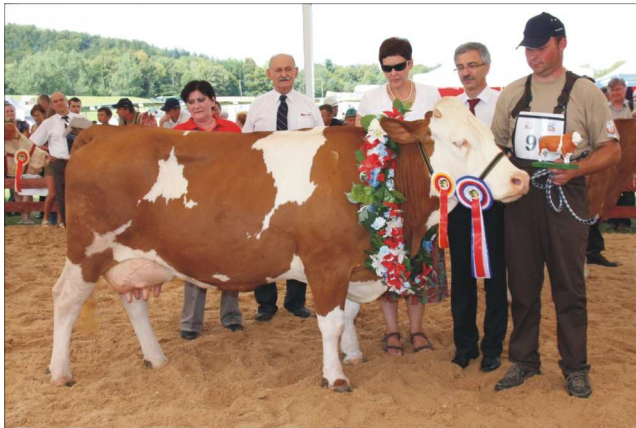
ELZA z hodowli M. Ziemiańskiego z Trześniowa – superczempion wśród krów