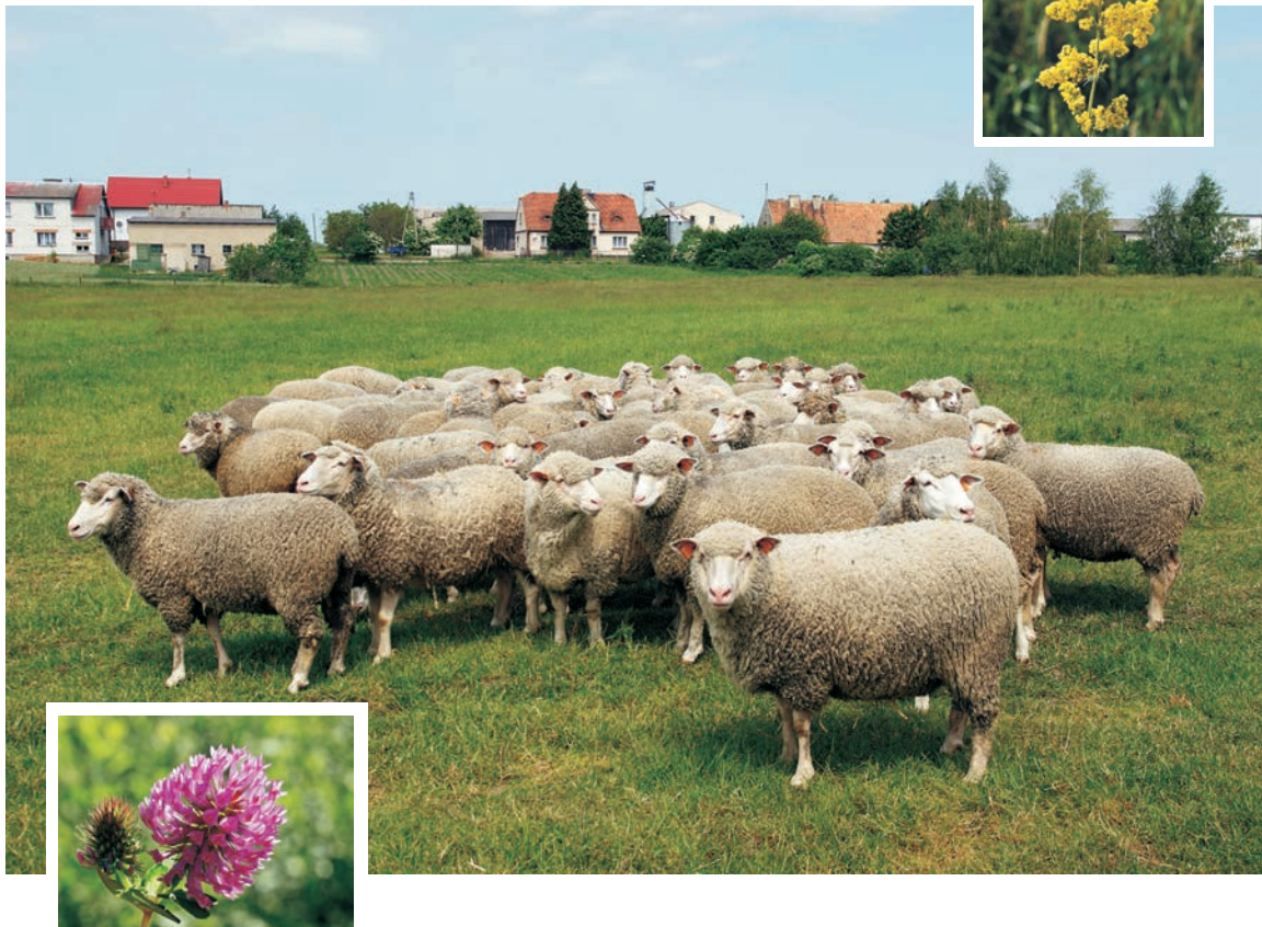
Owce rasy merynos polski (gospodarstwo T. Malaka z Januszkowa w pow. żnińskim) Polish Merino sheep (T. Malak farm, Januszkowo n. Żnin)