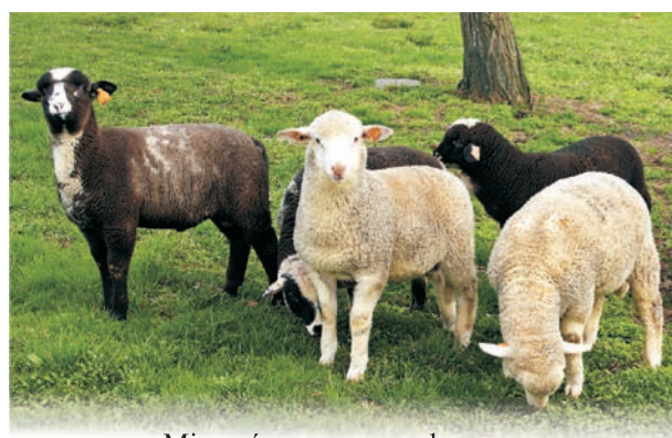
Mieszzańce merynosa barwnego Coloured Merino crossbreds