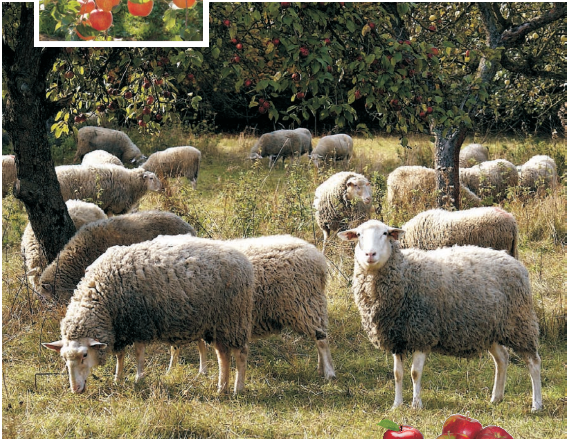
Owce kołudzkie – Kołuda sheep