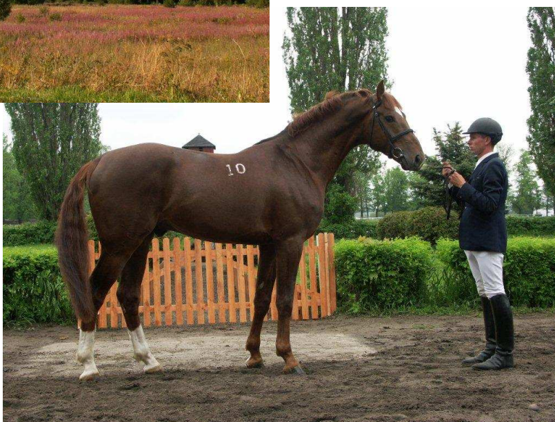
Ogier „Fin Wal” rasy małopolskiej (Walewice) – Małopolski stallion “Fin Wal” (Walewice)