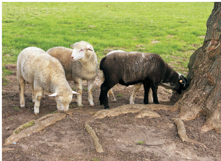
Tuczone tryczki rasy merynos barwny (z prawej) i miesza ce F_1 po Ile de France

Fattened Coloured Merino ram lambs (on the right) and Ile de France F_1 sheep