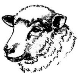
Tuczony tryczki rasy merynos barwny i mieszańce F_1 po Ile de France Fattened Coloured Merino ram lambs and Ile de France F_1 sheep