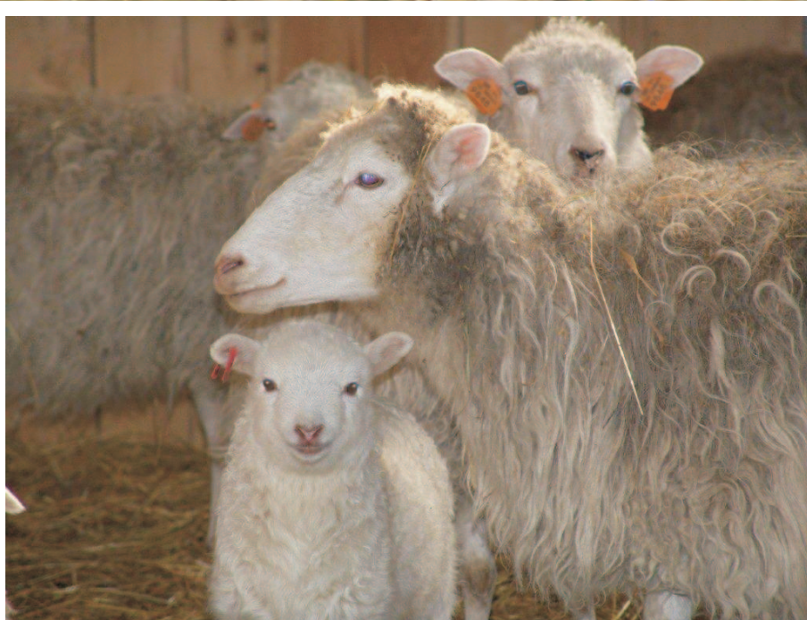
Owca winiarka Świniarka sheep