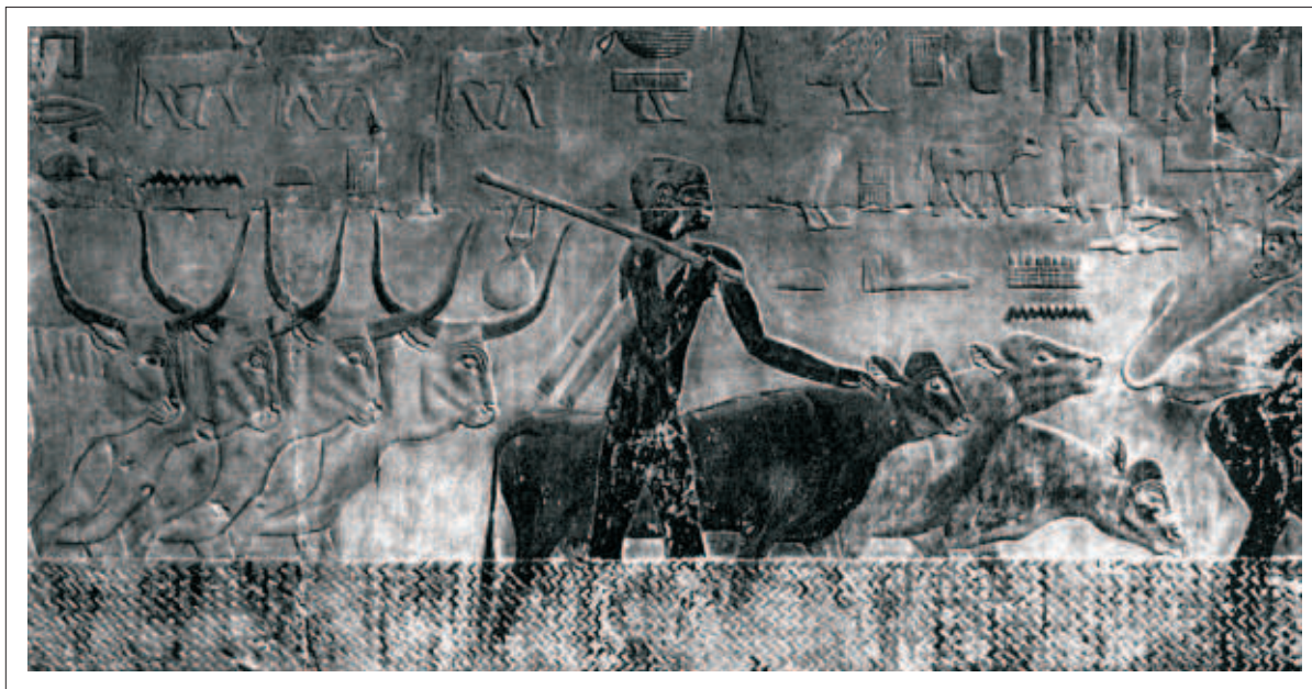
Powrót z pola - płaskorzeźba z grobowca Ti w Sakkara