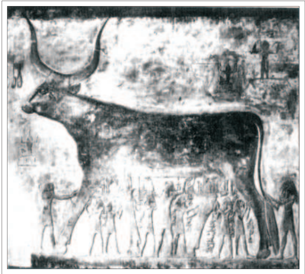
Krowa - detal z papirusu z przedstawieniem niebiańskiej krowy (Teby, ok. 1300 r. p.n.e.)