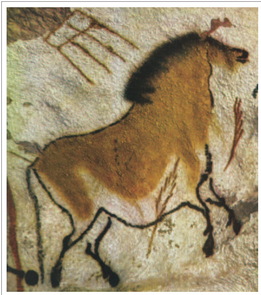
Koń – malowidło skalne w Lascaux k. Montignac-sur-Vézère (ok. 40 000 – 8500 lat p.n.e.)