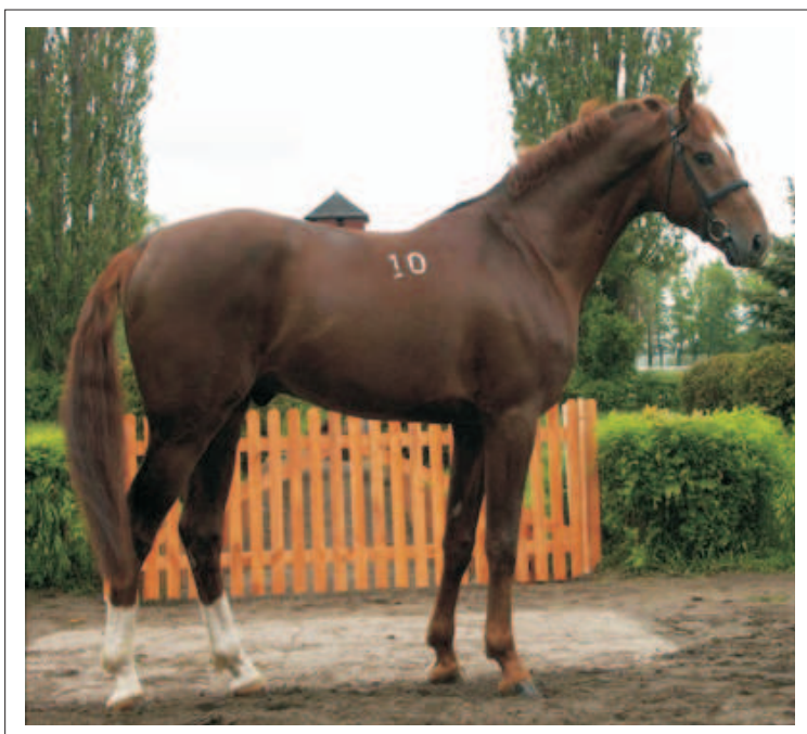
Ogier rasy małopolskiej