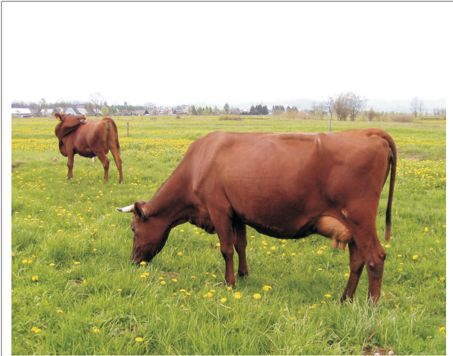
Bydło polskie czerwone