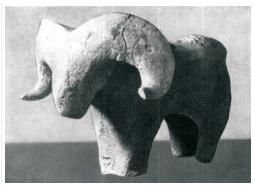
Baran z Suzy (ok. 4000 lat p.n.e.)