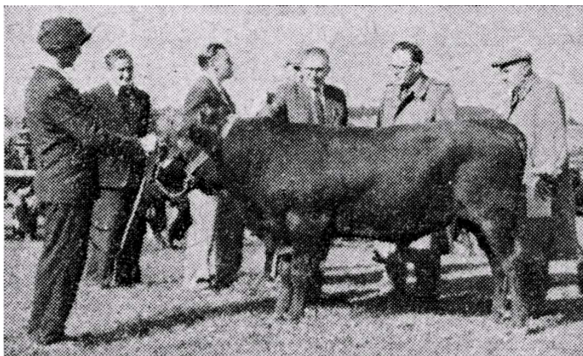
Komisja ocenia buhaja Jawora (ur. 1953 r.) Judges evaluate the Jawor bull (b. 1953)

powołano 15 lipca 1991 roku w Krakowie Małopolskie Towarzystwo Hodowców Bydła z siedzibą w Zabierzowie. Przyjęto statut, w którym określono, że członkiem Towarzystwa może być hodowca bydła zarodowego posiadający stado krów objęte kontrolą użytkowości mlecznej. Nie jest to związek dotyczący określonej rasy, lecz zrzesza właścicieli stad zarodowych wszystkich ras występujących w okręgu krakowskim. Naczelnym zadaniem statutowym jest wszechstronny rozwój hodowli bydła i ochrona interesów zrzeszonych w nim hodowców. Cele te Towarzystwo zamierzało osiągnąć między innymi poprzez: